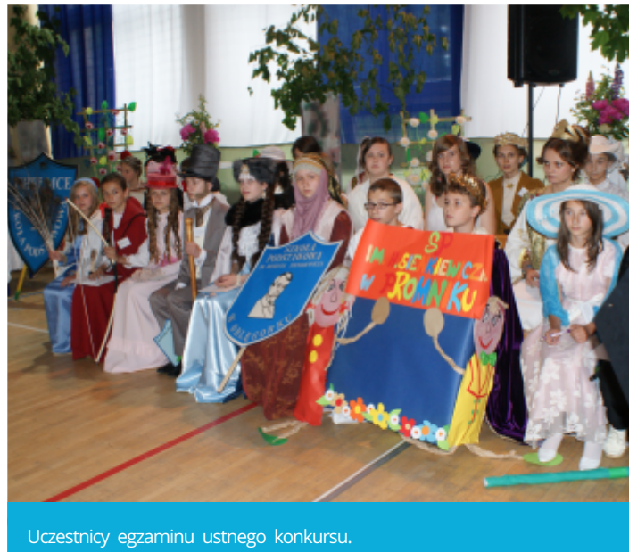
Uczestnicy egzaminu ustnego konkursu.