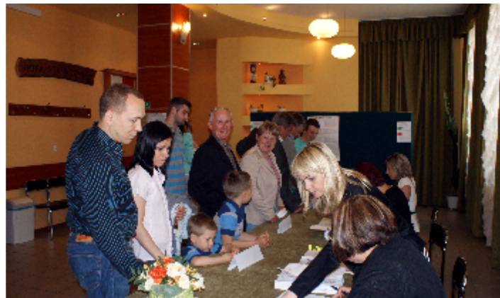
Głosownie w Obwodowej Komisji Wyborczej w Strawczynie