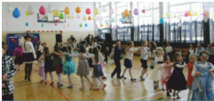
Dzieci ze SP w Korczynie prezentują swoje umiejętności artystyczne

Uczniowie przygotowali program artystyczny dla swoich ukochanych Babć i Dziadków. Szanowni Jubilaci, w tym roku przybyli szczególnie licznie na tę szczególną uroczystość. W tym dniu nie zabrakło