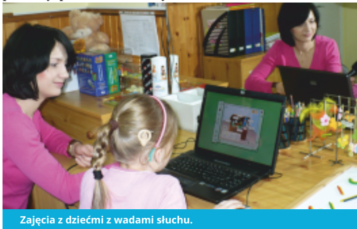
Zajęcia z dziećmi z wadami słuchu.

Implant ślimakowy stwarza szansę na wejście w świat dźwięków dzieciom z całkowitą głuchotą, które były pozbawione słuchu od urodzenia. Osobom, które słyszały od urodzenia, ale utraciły słuch z różnych przyczyn, daje szansę powrotu do świata dźwięków. Implant jest rozwiązaniem dla dzieci, które nie mogą korzystać z resztek słuchowych i nie mogą rozwinąć prawidłowo mowy za pomocą aparatów słuchowych.