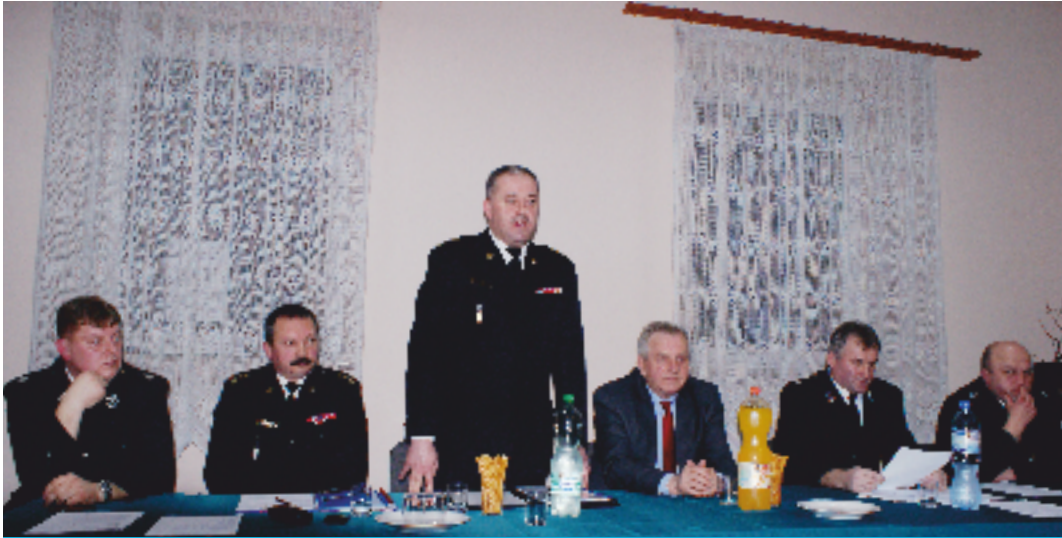
Przemawia zastępca komendanta wojewódzkiego PSP – st. bryg. Stanisław Woś

Tak spuentował swoje wystąpienie na Walnym Zebraniu Sprawozdawczym OSP w Promniku, 22 lutego br., wójt gminy Tadeusz Tkaczyk. Podkreślił mobilność jednostki przy zabezpieczaniu imprez gminnych, np. Strawczynady, zaangażowanie w niesieniu pomocy ludziom jej potrzebującym, pochwalił działalność gospodarczą i szkoleniową. Na koniec życzył druhom kolejnych sukcesów w niełatwej służbie.