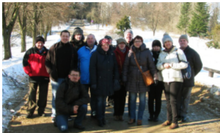
Goście z Niemiec na Świętym Krzyżu.

Czas spędzony wspólnie z niemieckimi partnerami upłynął szybko, w przyjaznej, jak zawsze, atmosferze. Wrócili oni do swojego kraju, by, po wymianie doświadczeń, kontynuować prace nad projektem.