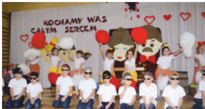
Występ uczniów SP w Oblęgorku

24 stycznia 2014 roku gościliśmy w naszej szkole, w Rudzie Strawczyńskiej, zacnych gości - Babcie i Dziadków, których święto wspólnie obchodziliśmy. Szanowni Jubilaci przybyli bardzo licznie na tę szczególną uroczystość.