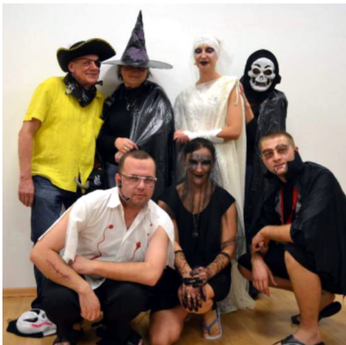
Tak bawiliśmy się na udanym Halloween w Centrum Sportowo-Rekreacyjnym „OLIMPIC”.

Samorządowe Centrum Kultury i Sportu w Strawczyńcu organizuje 31 października br. Halloween na basenie „Olimpic”. Od godz. 16:00 na pływalni panował będzie tajemniczy, mroczny klimat z udziałem czarownic, Białej Damy i innych upiórów.