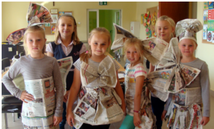
Pokaz mody gazetowej w świetlicy wiejskiej Korczynie.

Świetlice wiejskie to miejsce spotkań zarówno młodych jak starszych, tu nikt nie może się nudzić, każdy znajdzie coś dla siebie. Zajęcia w świetlicach odbywają się pod nadzorem instruktorów kultury SCKiS. Obecnie na terenie gminy Strawczyn czynnie funkcjonuje 5 świetlic w następujących miejscowościach: Chelmece, Hucisko, Korczyn, Promnik, Korczyn.