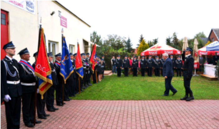
Inauguracja 80-lecia OSP w Oblęgorku.

Ochotnicza Straż Pożarna w Strawczynie, 30 sierpnia br., świętowała jubileusz 80-lecia powstania jednostki, podczas którego przekazano do użytku nowy ciężki pojazd ratowniczo-gaśniczy.