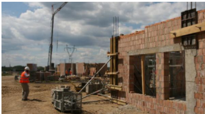
Prace budowlane na terenie przyszłego zakładu segregacji odpadów w Promniku

Kieleckie gazety, sześć monet i „List do przyszłości”, włożono do metalowej tuby, która została zamurowana w ścianie budowanego Zakładu Unieszkodliwiania Odpadów w Promniku. Budynki już wystają z ziemi, ale 16 czerwca 2014 r. uroczyste rozpoczęło inwestycję.