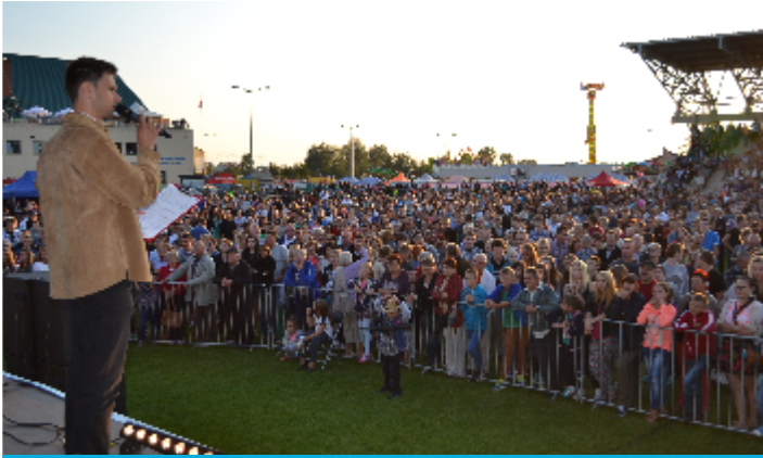
Mieszkańcy naszej gminy jak zwykle dopisali.