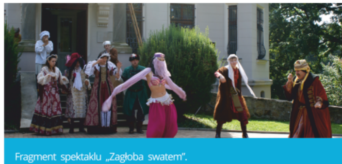
Fragment spektaklu „Zagłoba swatem”.