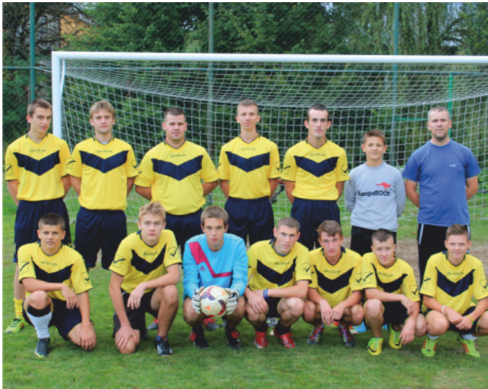
Drużyna Top-Spin Promnik