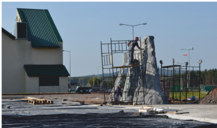
Prace budowlane na terenie Centrum Sportowo-Rekreacyjnego OLIMPIC

Znane w całym regionie Centrum Sportowo - Rekreacyjne w Strawczynku, przede wszystkim z basenu krytego, pięknego i nowoczesnego stadionu, zalewu, kręgielni oraz kortów tenisowych itp. otrzyma nowe obiekty, co sprawi, że ośrodek będzie jeszcze bardziej atrakcyjny.