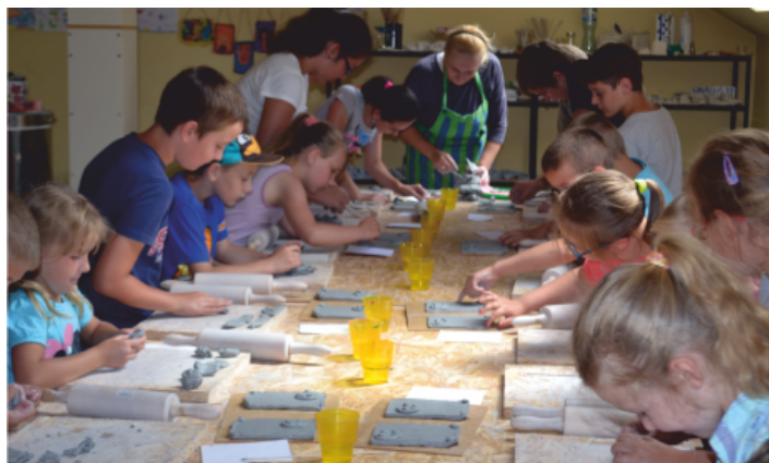
Zajęcia ceramiczne w naszej pracowni w świetlicy wiejskiej w Strawczynku

Zajęcia odbywają się w każdą środę od 17:00 do 19:00 w profesjonalnej pracowni ceramicznej utworzonej w świetlicy w Strawczynku. Zapewniamy wszystkie potrzebne materiały: glinę, farby, lakiery, posiadamy własny piec do wypалу ceramiki. Na zajęcia trzeba więc zabrać tylko odpowiedni strój, którego nie żal pobrudzić oraz chęci do wspaniałej twórczej zabawy.