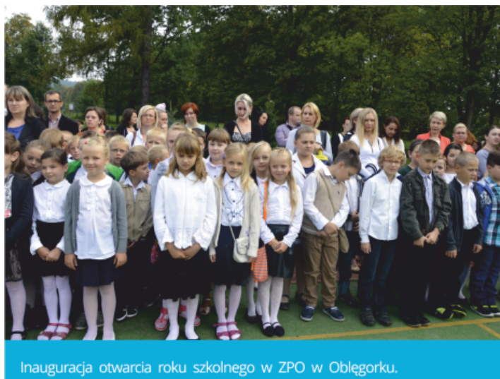
Inauguracja otwarcia roku szkolnego w ZPO w Oblęgorku.

Pierwszego września na szkolnym boisku Zespołu Placówek Oświatowych w Oblęgorku nastąpiła uroczysta inauguracja roku szkolnego 2014/15. Uroczystość zgromadziła nie tylko uczniów, ale także bardzo wielu rodziców.