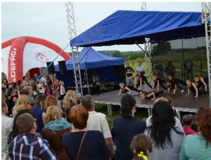
Pokaz taneczny dzieci ćwiczących na codzien na warsztatach tanecznych organizowanych przez SCKiS.

31 maja br. na terenie Centrum Sportowo – Rekreacyjnego "Olimpic" odbyła się impreza z okazji Dnia Dziecka. Samorządowe Centrum Kultury i Sportu w Strawczyźnie z myślą o milusińskich przygotowało wiele niesamowitych atrakcji.