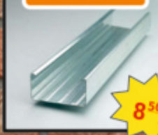
Profil główny CD-60 4m