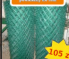
Siatka ogrodzeniowa ocynk powlekany 2.0 10m