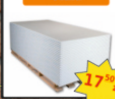
Płyta G-K biała