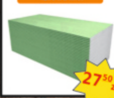
Płyta G-K zielona