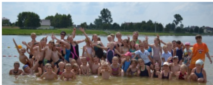
Grupa dzieci podczas zajęć na Półkolonii 2014.

Po raz kolejny Samorządowe Centrum Kultury i Sportu w Strawczynie organizuje półkolonie letnie w celu dostarczenia dzieciom ciekawych zajęć i wiele rozrywki.