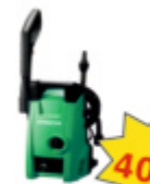
Myjka ciśnieniowa HITACHI 100 bar