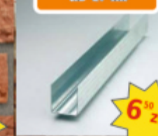
Profil przyścienny UD-27 4m