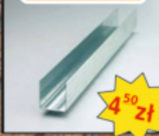
Profil przyścienny UD-27 3m