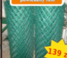
Siatka ogrodzeniowa ocynk powlekany 10m