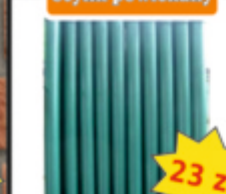
Stupek do siatki ocynk powlekany