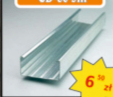
Profil główny CD-60 3m