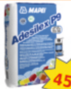
Klej elastyczny do płytek ADESILEX P9