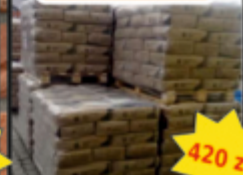
Cement 42.5 czarny