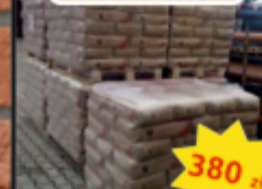
Cement 32.5 czerwony