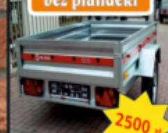
Przyczepa bez plandeki