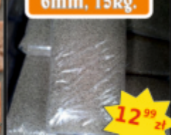
EcoPellet 6mm, 15kg.