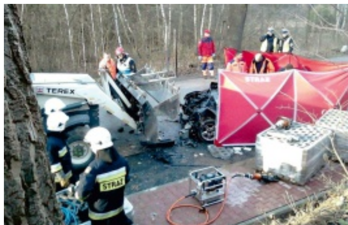
Strażacy ogrodzili wrak samochodu wysokim parawanem.

W Kuźniakach - w gminie Strawczyn - 30 listopada br., w godzinach wczesnopopołudniowych doszło do tragicznego wypadku na drodze nr 786.