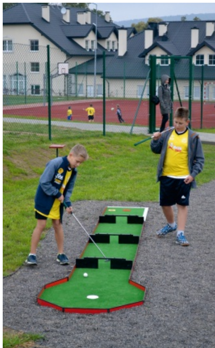
18-dołkowe pole do minigolfa na terenie Centrum Sportowo-Rekracyjnego OLIMPIC.

Kolejne budynki użyteczności publicznej: Urząd Gminy, ośrodek zdrowia w Strawczynie i świetlice wiejskie wyposażono w systemy