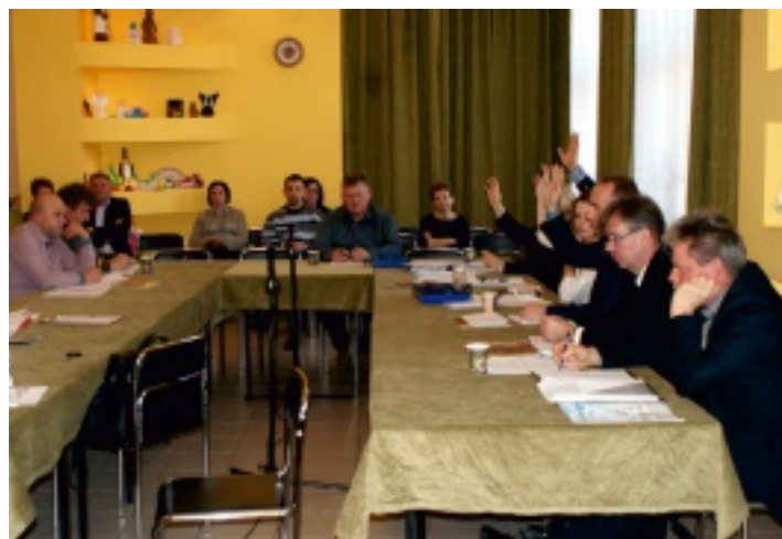
Radni głosują nad obniżeniem podatku rolnego.

Rada przyjęła następną informację o realizacji zadań oświatowych w gminie