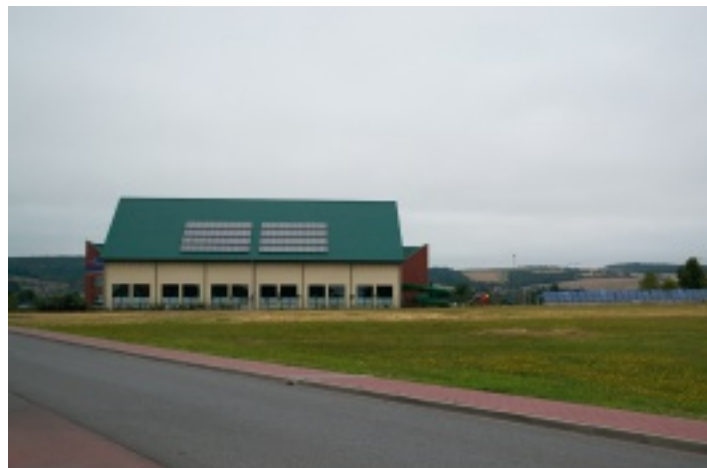
Kryta pływalnia OLIMPIC w Strawczynku wyposażona jest w szereg usprawnień, które pozwalają obniżyć koszty, dbając jednocześnie o środowisko naturalne.

służące ogrzewaniu wody. I w tym przypadku wykorzystano środki unijne z Programu Rozwoju Obszarów Wiejskich 2007 – 2014. Koszt inwestycji: 105 tys. zł, z tego dofinansowanie wyniosło 64 tys. zł.