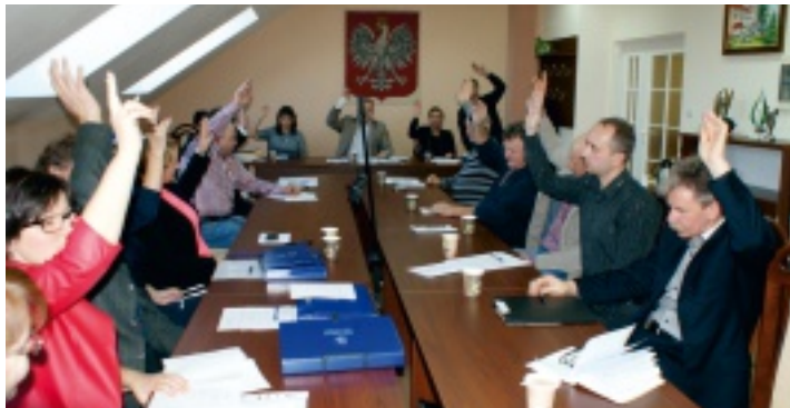
Radni jednogłośnie przyjęli uchwałę RG o strategii rozwoju gminy.