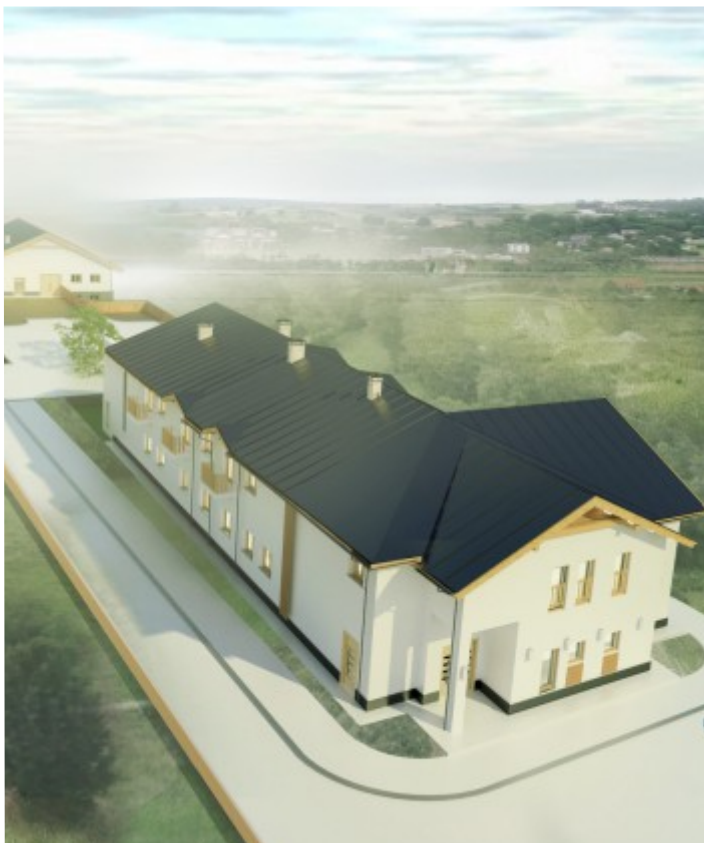
Makieta ośrodka - z lotu ptaka

W związku z powyższym, ośrodek informuje o możliwości skorzystania ze wsparcia w ramach projektu osób korzystających ze świadczeń pomocy społecznej. Udział w projekcie jest bezpłatny.