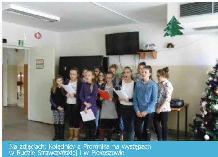
Na zdjęciach: Kołędnicy z Promnika na występach w Rudzie Strawczyńskiej i w Piekoszowie