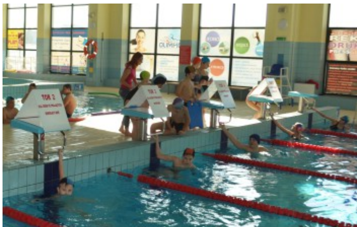
W ferie pływalnia OLIMPIC zaferuje dodatkowe zajęcia.

Ferie zimowe w naszym regionie rozpoczną się praktycznie już 14 lutego (sobota) i potrwać do piątku - 27 bm. W tym roku placówki kulturalne, szkoły, kluby sportowe w naszej gminie oraz pływalnia w Strawczynku postarały się o wyjątkowo atrakcyjną ofertę dla dzieci i młodzieży. Głównym organizatorem imprez i wydarzeń na terenie gminy jest Samorządowe Centrum Kultury i Sportu w Strawczynie