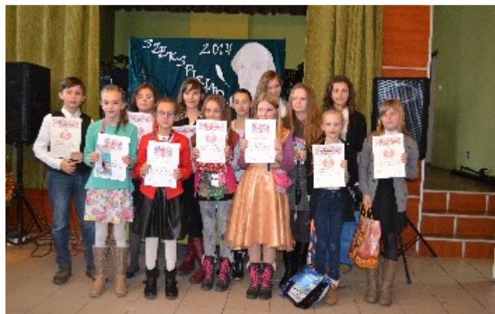
Uczestnicy Gminnego Konkursu Poezji i Prozy Angielskiej.