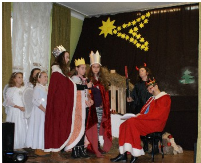
Jasełka w wykonaniu uczniów SP z Rudy Strawczyńskiej.