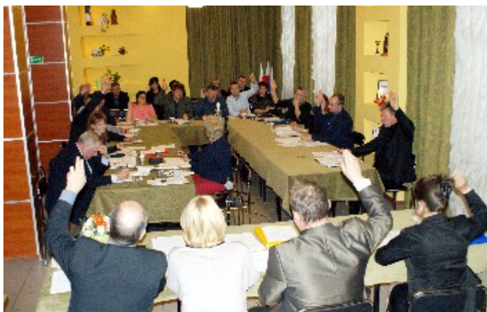
Radni przyjmują budżet gminy na 2015 rok.

Jedną z najważniejszych decyzji Rady Gminy w 2014 roku została uchwalona: 29 grudnia rada podjęła uchwałę o przyjęciu budżetu gminy na 2015 rok. Ponadto przyjęto uchwały dotyczące: stawek dotacji przedmiotowej dla Zakładu Gospodarki Komunalnej, w sprawie trybu udzielenia i rozliczania dotacji dla publicznych przedszkoli prowadzonych przez osoby prawne i fizyczne, zmieniającą uchwałę w sprawie budżetu na 2014 rok, w sprawie zmian w Wieloletniej Prognozie Finansowej gminy na lata: 2014 -2024 oraz w sprawie przyjęcia Gminnego Programu Profilaktyki i Rozwiązywania Problemów Alkoholowych i Przeciwdziałania Narkomanii na 2015 rok.