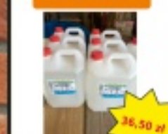
Roszczeniak NITRO Cazer 5l