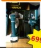
Makita zestaw narzędzi do masywnej konstrukcji