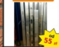
Łaty firmy PRO