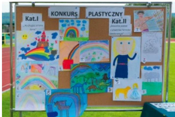
Konkurs plastyczny "Dowolna postać z utworów Henryka Sienkiewicza" SCKiS zorganizowało wspólnie z Pałacym Henryka Sienkiewicza w Oblęgorku.