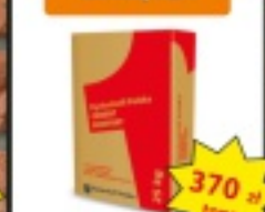
Cement czerwony 32,5 l