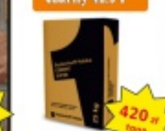
Cement czarny 42,5 l