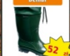
Buty gumowe Demar