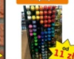
Lakiery w sprayu