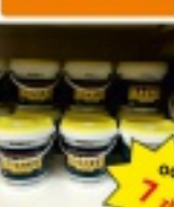
Masa szpachlowa MASTER MAS