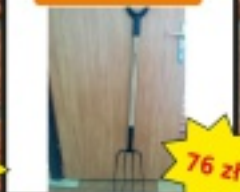
Widły solid Fiskars