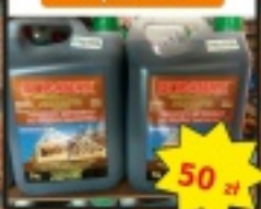
Impregnat ściżby dachowej brop/olejek 5l