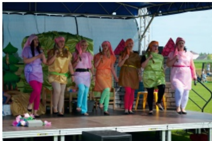
Przedstawienie "Królewna Śnieżka i siedmiu krasnoludków" przygotowały przedszkolanki z punktów przedszkolnych prowadzonych przez SCKiS w Strawczyźnie.

Kolejną atrakcją było przedstawienie pt. „Królewna Śnieżka i siedmiu krasnoludków”. Pokaz teatralny zaprezentowany został przez dorosłych, a w role postaci bajkowych wcieliły się