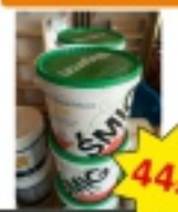
Masa szpachlowa smig 20 kg