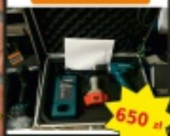
Wiertarka MAKITA z zestawem narzędzi