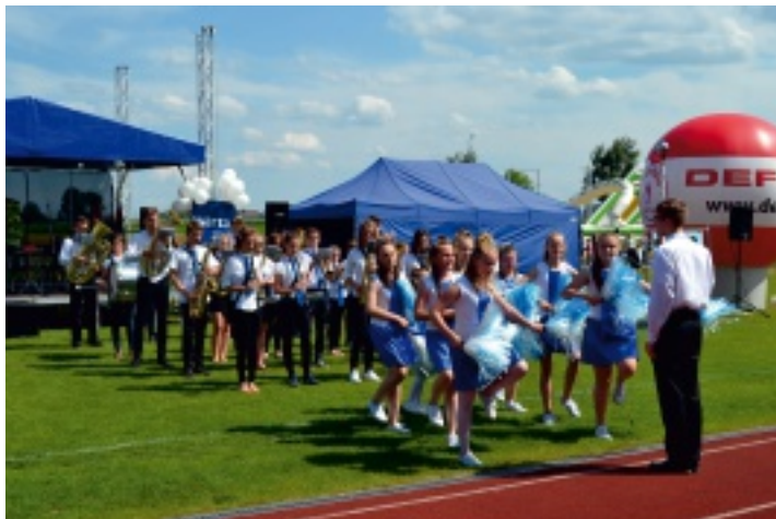
Orkiestrze Dętej ze Strawczyzna towarzyszyły mażoretki z OLIMPIC Dance Studio.

Jak co roku Samorządowe Centrum Kultury i Sportu w Strawczyźnie zorganizowało festyn z okazji Dnia Dziecka. W niedzielę, 29 maja 2016 r., na terenie Centrum Sportowo-Rekreacyjnego OLIMPIC w Strawczyńku na dzieciaki czekała moc atrakcji.