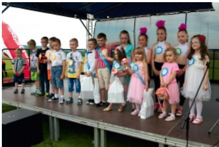
Wybory Małej Miss i Małego Mistera wzbudziły ogromne zainteresowanie publiczności.

która podczas festynu prowadziła dla chętnych warsztaty lepienia z gliny.