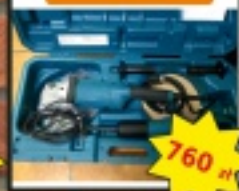
Makita zestaw dwóch szlifierki malarskiej