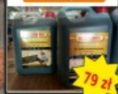
Impregnat drewna bonstr. olejny/bropawy 5l