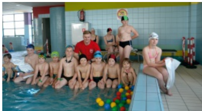
Pływalnia OLIMPIC z okazji Dnia Dziecka zorganizowała dla najmłodszych zabawę w wodzie.