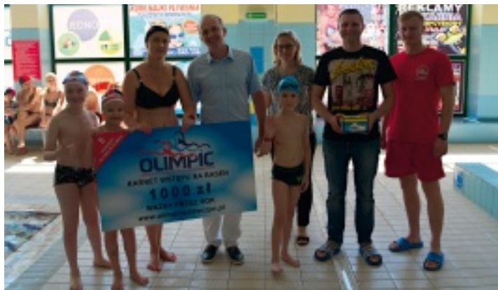
Trójka szczęśliwców wygrała w loterii karnety wstępu na basen o wartości 1000 zł.

W weekend 28 i 29 maja 2016 r. świętowaliśmy 5. urodziny pływalni OLIMPIC. Z tej okazji wszyscy mieszkańcy gminy Strawczyn mogli skorzystać z basenu za darmo. Idea ta przypadła im do gustu – blisko 200 osób skorzystało z bezpłatnego wejścia. Dla klientów spoza terenu naszej gminy przygotowaliśmy na te dwa dni promocję 2 za 1, czyli dwie godziny w cenie jednej.