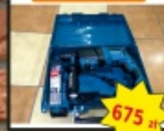
Młotowiertarka makita + 3 wiśla