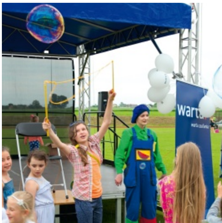
Kuglarze przywieźli ze sobą m.in. wielkie bańki mydlane.