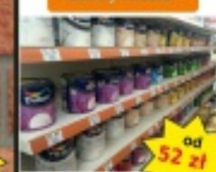
Farby DULUX kolory świata