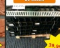
Kratka odpływowa do kostki