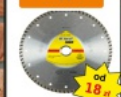
Tarcze diamentowe Ningpor