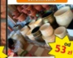
Donice zewnętrzne ceramiczne