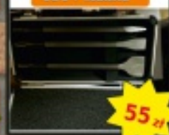
Zestawe dłut SDS+ Makita