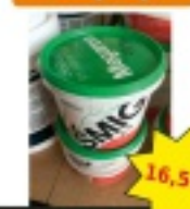
Masa szpachlowa smig 5 kg