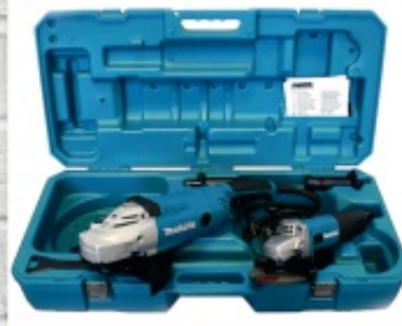
zestaw szlifierek Makita