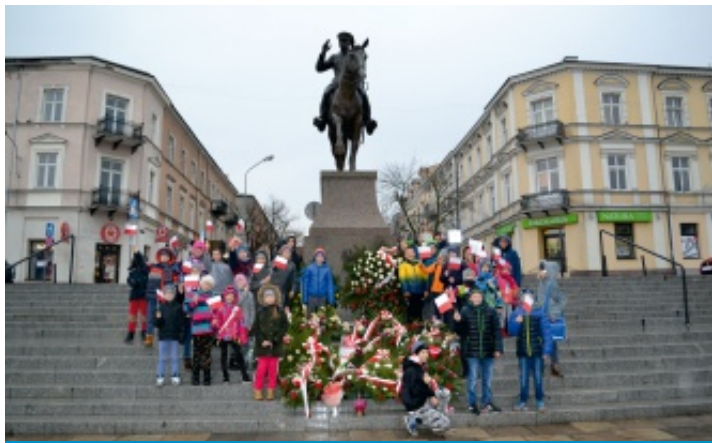
Dzieci złożyły kwiaty pod pomnikiem Marszałka Piłsudskiego.

19 listopada 2016 r. dzieci ze świetlic prowadzonych przez Samorządowe Centrum Kultury i Sportu w Strawczynie udały się na wycieczkę do Ośrodka Myśli Patriotycznej i Obywatelskiej na Wzgórzu Zamkowym w Kielcach. Wyjazd został zorganizowany w ramach obchodów Narodowego Święta Niepodległości.