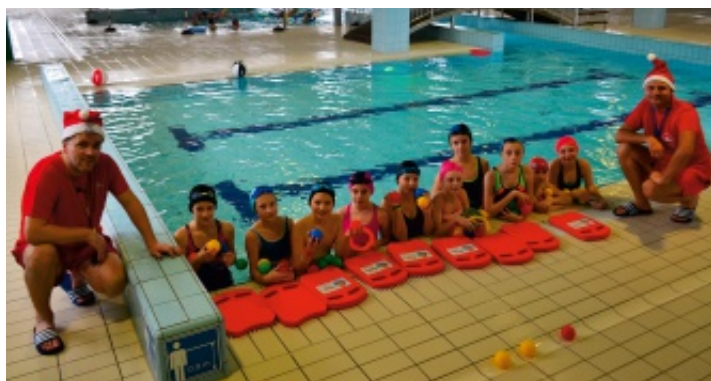
Elfy św. Mikołaja zorganizowały zabawy dla najmłodszych...

6 grudnia 2016 r. pływali OLIMPIC odwiedziła liczna grupa dzieciaków i osób dorosłych – dla każdego św. Mikołaj przyniósł drugą godzinę korzystania z basenu gratis. Nie brakowało chętnych do pływania, ale i bardziej rekreacyjne rozrywki znalazły swoich amatorów.