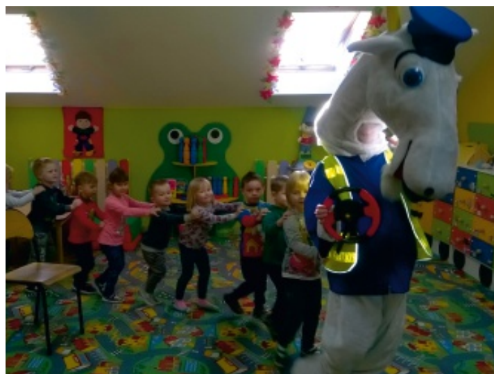
Dzieci poznawały zasady bezpieczeństwa podczas zabaw.

5 grudnia 2016 r. do punktu przedszkolnego w Strawczyńcu zawitał policjant w towarzystwie posterunkowego Koziołka Matolka. Celem zajęć było zapoznanie dzieci z zasadami bezpiecznego poruszania się po drodze, poznanie symboli kolorów świateł sygnalizatora, uświadomienie konieczności jeżdżenia w fotelikach z zapiętymi pasami, uczulenie ich na zachowanie bezpieczeństwa w stosunku do obcej osoby dorosłej, a także bezpieczeństwa podczas zabaw zimowych i wzbudzenie pozytywnego stosunku do pracy policjanta.