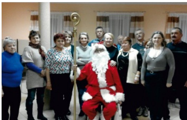
Niestety w tym roku św. Mikołaj nie przyniósł zespołowi upragnionych strojów...