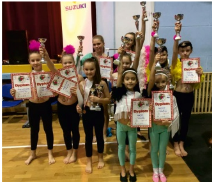
Zawodniczki OLIMPIC Dance Studio zdobywają coraz lepsze miejsca na zawodach tanecznych.

10 grudnia 2016 r. w hali widowiskowo-sportowej przy ul. Żytniej w Kielcach odbył się XIII Mikołajkowy Turniej Tańca zorganizowany przez Świętokrzyski Klub Tańca Jump. Działające przy Samorządowym Centrum Kultury i Sportu OLIMPIC Dance Studio godnie reprezentowało naszą gminę.