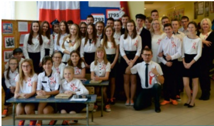
W akademię zaangażowali się uczniowie ze wszystkich klas.