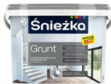
grunt Śnieżka 10l