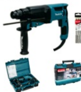
młotowiertark a Makita