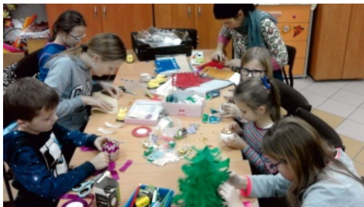
Na warsztatach powstają piękne ozdoby tradycyjne i współczesne.

Okres poprzedzający Święta Bożego Narodzenia jest jednym z najpiękniejszych w roku. Kolorowe lampki oraz ozdoby choinkowe cieszą oczy różnorodnością kształtów. Jednak w tej całej estetycznej otoczce mimowolnie zatracane są dawne zwyczaje oraz techniki tworzenia tradycyjnych ozdób choinkowych, które niegdyś zdobiły drzewka i izby naszych przodków.