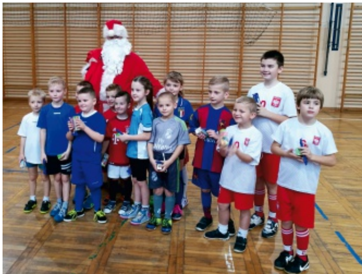
"Młode Orły" podczas Turnieju odwiedził św. Mikołaj.

3 grudnia 2016 r. w hali szkolnej w Promniku odbył się Mikołajkowy Turniej Piłkarski Młodych Orłów zorganizowany przez Szkołę Piłkarską OLIMPIC prowadzoną przez Samorządowe Centrum Kultury i Sportu w Strawczynie. Zawody skierowane były do dzieci w wieku 5 – 12 lat.