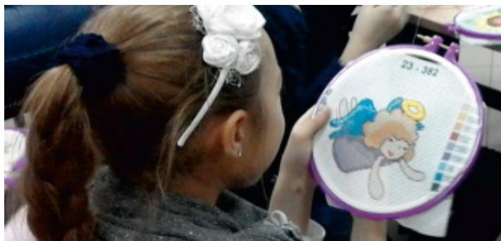
Każdy może nauczyć się haftować...

Od listopada w świetlicach wiejskich prowadzonych przez Samorządowe Centrum Kultury i Sportu w Chełmcach i Strawczynku w każdą środę odbywają się zajęcia z hafciarstwa. Skierowane są do wszystkich, małych i dużych, którzy interesują się „malowaniem igłą na tkaninie”.