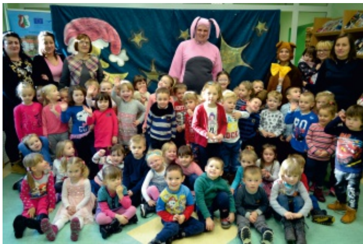
Elfy św. Mikołaja zorganizowały zabawy dla najmłodszych...

Od września do listopada 2016 r. dzieci z punktów przedszkolnych w Oblęgorze, Oblęgorku i Strawczynku uczestniczyły w cyklu zajęć bibliotecznych. Były to początkowo zajęcia w przedszkolach, które prowadziły nauczycielki, a celem ich było wprowadzenie i zapoznanie maluchów z literaturą dziecięcą, m. in. bajką, baśnią, wierszami, rymowanymi i opowiadaniem.