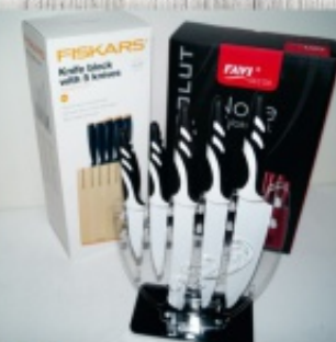
noże w bloku

Z okazji Świąt Bożego Narodzenia pragniemy złożyć wszystkim naszym Klientom najserdeczniejsze życzenia, wielu sukcesów, a także radości i uśmiechu.