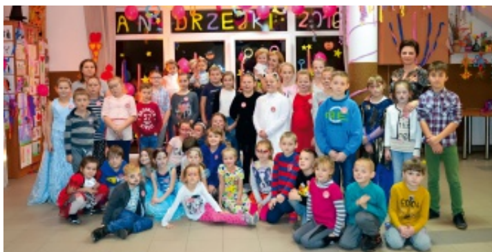
Z okazji andrzejek w Promniku odbył się bal przebierańców.

Samorządowe Centrum Kultury i Sportu w Strawczynie po raz kolejny zorganizowało dla dzieci zabawę andrzejkową. Impreza ta odbyła się w 25 listopada 2016 r. w świetlicy w Promniku i cieszyła się dużym zainteresowaniem. Przybyło na nią wiele dzieci z tajemniczo wymalowanymi twarzami, przebranych za księżniczki, Spidermen'ów, koty i inne ulubione postacie bajkowe. Każdy uczestnik biorący udział w andrzejkowym wieczorze dostał znaczek upamiętniający udział w tej zabawie oraz został obdarzony słodkim łakociem.