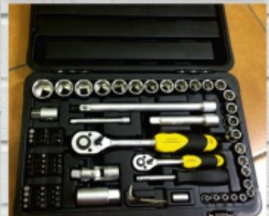
kpl kluczy nasadowych