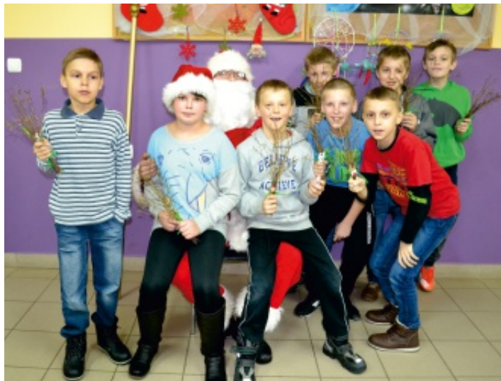
W świetlicach SCKiS św. Mikołaj rozdawał łakocie i różgi.