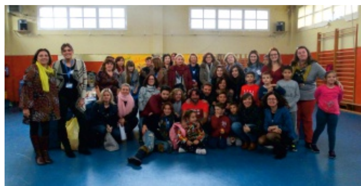
Nauczyciele ze Strawczyna spotkali się z kolegami z Europy.