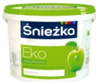
Śnieżka Eko 10l