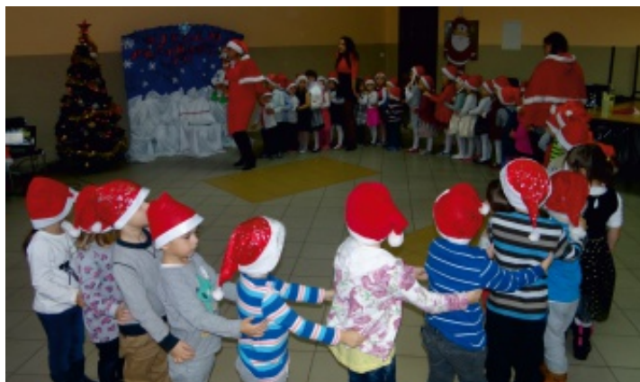
Mikołaj przybył do przedszkolaków z workami pełnymi prezentów.

6 grudnia 2016 roku w świetlicy w Strawczyńcu punkty przedszkolne z Oblęgora, Oblęgorka oraz Strawczyńka, podlegające pod Samorządowe Centrum Kultury i Sportu w Strawczyńcu, wzięły udział w podróży do krainy Świętego Mikołaja.