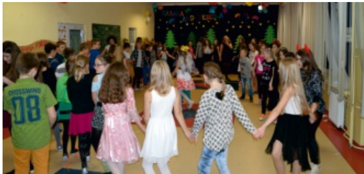
Młodzież sama udekorowała salę, na której odbyła się zabawa.

23 listopada 2016 r. w Zespole Placówek Oświatowych w Strawczynie odbyła się zabawa andrzejkowa. Od 13.00 do 15.00 bawili się najmłodsi: klasy 0-III szkoły podstawowej. Od 15.00 do 17.00 na parkiecie szaleli ich starsi koledzy i koleżanki z klas IV-VI, a zabawa dla gimnazjalistów trwała od 17.00 do 19.00.