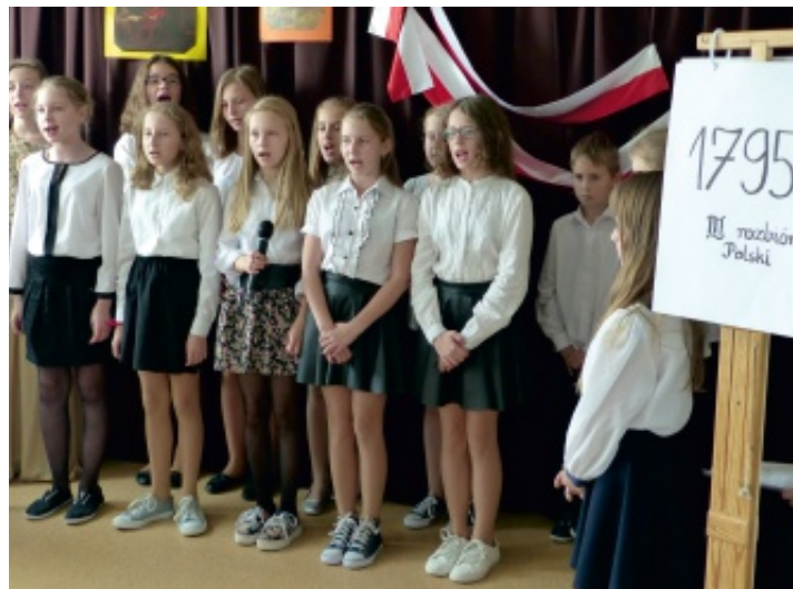
Na pamiątkę odzyskania przez Polskę niepodległości w SP w Rudzie Strawczyńskiej śpiewano patriotyczne pieśni.

Polska to kraj piękny i malowniczy. Warto uczyć dziecko miłości do tego, co polskie. Trzeba wytłumaczyć mu, co to jest honorowa zmiana wart w obecności prezydenta i jak ważne są nasze symbole narodowe. Każdy z nas jest ciekaw, kim byli jego przodkowie, czego dokonali i jakie były ich losy. Narodowe Święto Niepodległości jest wspaniałą okazją do lekcji patriotyzmu.