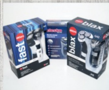
maszynki do golenia