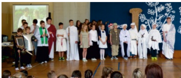
W Promniku 100. rocznicę śmierci patrona szkoły – Henryka Sienkiewicza – połączono z obchodami 1050 chrztu Polski.

W piątek 18 listopada 2016 r. o godz. 11.00 w Zespole Placówek Oświatowych w Promniku odbyła się uroczystość upamiętniająca setną rocznicę śmierci patrona szkoły, Henryka Sienkiewicza, oraz 1050. rocznicę chrztu Polski. W uroczystości wzięli udział uczniowie, rodzice oraz zaproszeni goście.