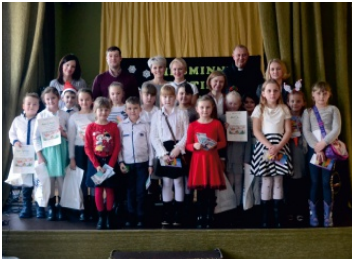
Uczestnicy festiwalu z opiekunami i jury.

8 grudnia 2016 r. w świetlicy Samorządowego Centrum Kultury i Sportu w Strawczyźnie odbył się VII Gminny Festiwal Piosenki Angielskiej dla klas I-III Szkół Podstawowych zorganizowany przez Szkołę Podstawową w Niedźwiedziu. Na festiwal przybyli uczniowie ze szkół z terenu naszej gminy.