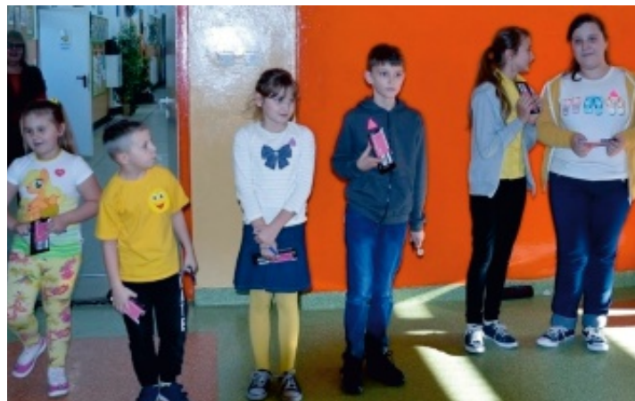
Najżyczliwsi uczniowie z kl. I - VI.

Zwycięska drużyna oraz najżyczliwsi uczniowie otrzymali nagrody. Ten dzień był pełen wrażeń, serdeczności i miłości.