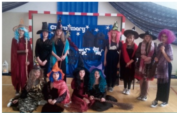
Zabawę zorganizowały przebrane za wróżki i czarownice uczennice kl. VI.

Jest taka noc w roku, kiedy świat realny łączy się ze światem magii, czarów, ...wróżb. Od wieków w noc św. Andrzeja młode panny zbierały się, aby dowiedzieć się jaka będzie ich przyszłość. Panowie, ciekawi co ich spotka, zbierali się kilka dni wcześniej – w wigilię św. Katarzyny.