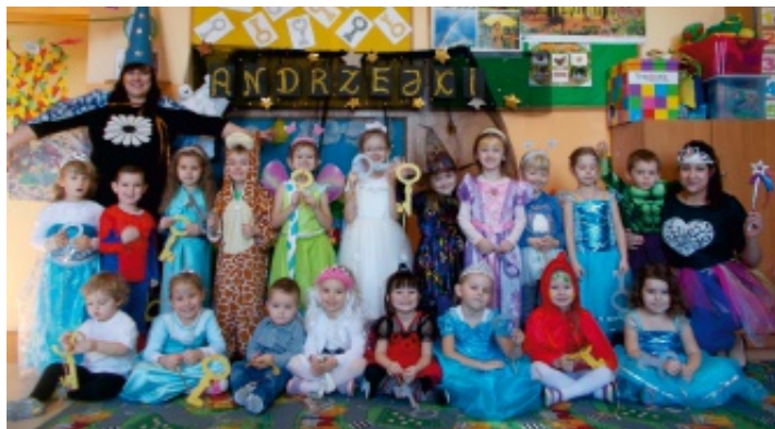
Uczestnicy festiwalu z opiekunami i Jury.

25 listopada 2016 r. w punkcie przedszkolnym „Oblęgorskie Smerfy” prowadzonym przez Samorządowe Centrum Kultury i Sportu w Strawczyńcu odbył się Bal Andrzejkowy. Tego dnia przedszkole odwiedziła Wróżka z Czarnej Góry, która zapoznała dzieci z tradycjami i zabawami andrzejkowymi obchodzonymi w Polsce.