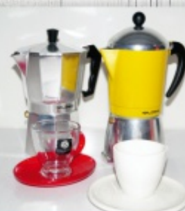
kawiarki i filiżanki