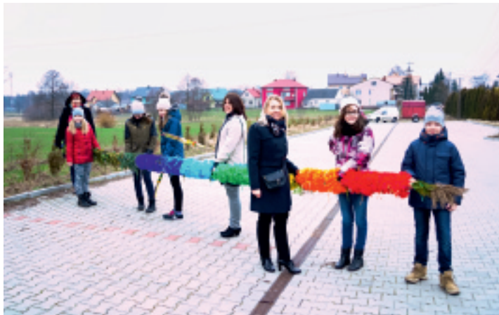
Najdłuższą palmę w kat. dzieci zrobili uczniowie kl. V Szkoły Podstawowej w Strawczynie.

Niedziela Palmowa rozpoczyna Wielki Tydzień, którego ostatnie dni stanowią pamiątkę Męki oraz Zmartwychwstania naszego Pana, Jezusa Chrystusa. Początek Wielkiego Tygodnia to także święcenie palm. W ten sposób upamiętniamy uroczysty przyjazd Syna Bożego do Jerozolimy. W Strawczynie zwyczaj ten staje się wyjątkowym wydarzeniem.