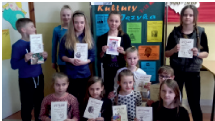
Szkolni Mistrzowie Ortografii z Korczyna.

Szkoła otwarta na kulturę i czytelnictwo – pod takim hasłem Szkoła Podstawowa w Korczynie obchodziła w dniach 7-12 marca 2016 r. Tydzień Kultury Języka. Przez cały ten czas uczniowie starali się świadomie uczestniczyć w kulturze oraz ją promować.