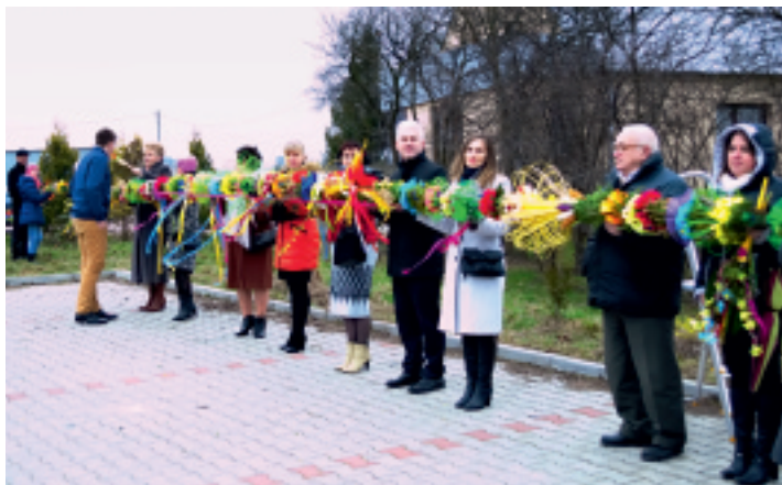
Zwycięska palma z Rudy Strawczyńskiej.

Przed procesją palmy prezentowano na parkingu przykościelnym. W konkursie wzięło udział 8 palm, przy wykonaniu których pracowało ok. 70 osób. Najwyższa palma miała 10,5 m wysokości i zrobiły ją panie z sołectwa Ruda Strawczyńska . Na drugim miejscu (7,90 m) znalazła się palma wykonana przez panie ze Stowarzyszenia Przyszłość Strawczynka , a przyniesiona została przez