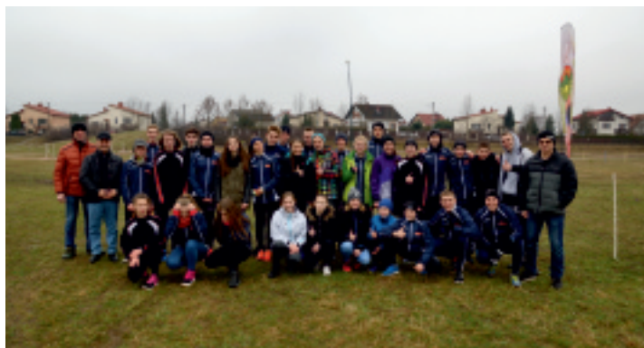
Stowarzyszeni Sportowo-Rekreacyjne OLIMP Strawczyn.

Stowarzyszenie Sportowo-Rekreacyjne OLIMP istnieje już ponad 3 lata. 16 marca 2016 r. w świetlicy Samorządowego Centrum Kultury i Sportu w Strawczynie odbyło się zebranie podsumowujące dotychczasową działalność klubu.