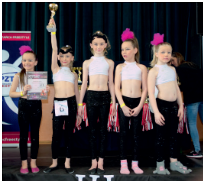
Zawodniczki OLIMPIC Dance Studio osiągają coraz lepsze wyniki na arenie ogólnopolskiej.