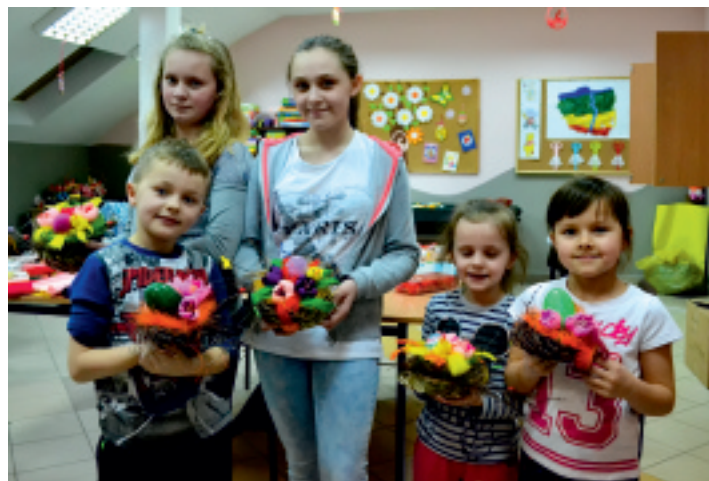
Uczestnicy warsztatów na świetlicy w Strawczynku.