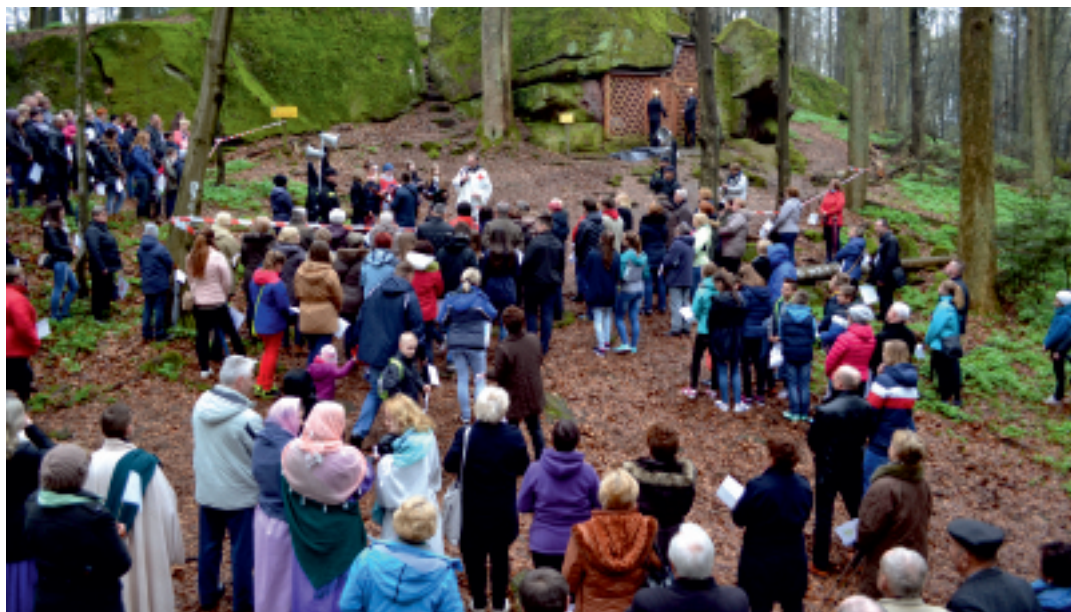
Nabożeństwo rozpoczęło się na Górze Perzowej.

10 kwietnia 2016 r. w Strawczyni odbyła się inscenizacja Drogi Światła, która była kontynuacją Drogi Krzyżowej, jaka odbyła się na Górze Perzową.