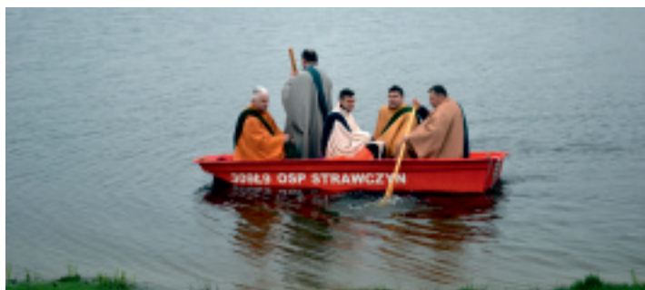
Uczniowie Jezusa na Jeziorze Tyberiadzkim.