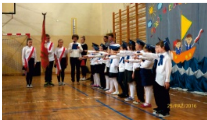
Pierwszaki z SP w Promniku ślubowały na sztandar szkoły.