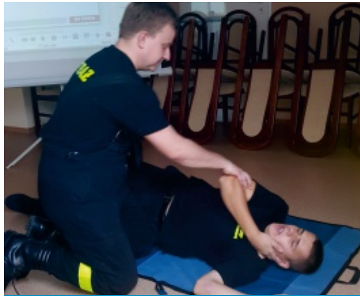
Pokaz pozycji bocznej ustalonej. Kurs Pierwszej Pomocy Przedmedycznej w ramach realizowanego programu.

Projekt „Przeciwdziałanie zjawiskom patologii oraz ochrona dzieci i młodzieży w Gminie Strawczyn” współfinansowany ze środków otrzymanych od Wojewody Świętokrzyskiego w ramach Programu Razem Bezpieczniej im. W. Stasiaka na lata 2016 i 2017 na podstawie Porozumienia 87/2016 z dnia 19 października 2016 r.