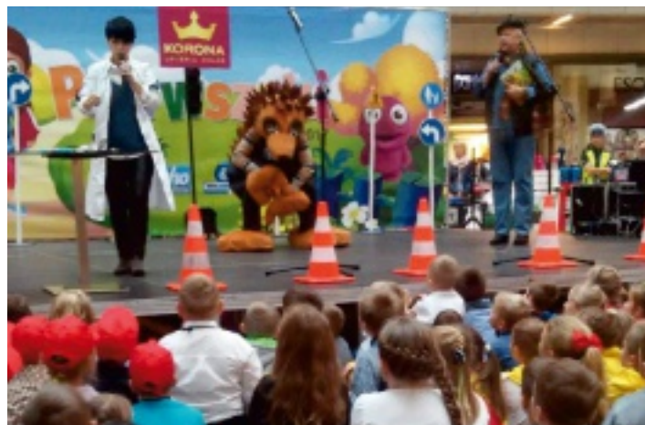
Dzieciom bardzo podobała się maskotka Echa Dnia - Jeż Edek.

18 października 2016 r. pierwszaki z Promnika były na spotkaniu w galerii Korona w Kielcach, zorganizowanym już po raz 14 przez dziennik „Echo Dnia”. Wielką atrakcją był Jeż Edek, maskotka gazety. Na scenie wystąpili: policjantki, doktor z Centrum Pediatrii w Kielcach, strażacy oraz przedstawiciel KRUS-u. Na zakończenie dzieci odpowiadały na pytania konkursowe, w