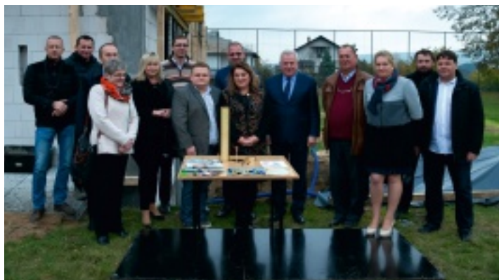
W uroczystości wzięli udział przedstawiciele Urzędu Gminy w Strawczynie oraz firm realizujących inwestycję.

19 października 2016 r. uroczystie podpisano akt erekcyjny i wmurowano kamień węgielny pod budowę nowego przedszkola w Strawczynie. Było to symboliczne wydarzenie, ponieważ prace trwają tam już od kilku tygodni. Na dawnym boisku za Urzędem Gminy powstanie budynek, w którym znajdzie się 5 oddziałów przedszkolnych – dla 120 dzieci oraz żłobek dla 16 maluchów.