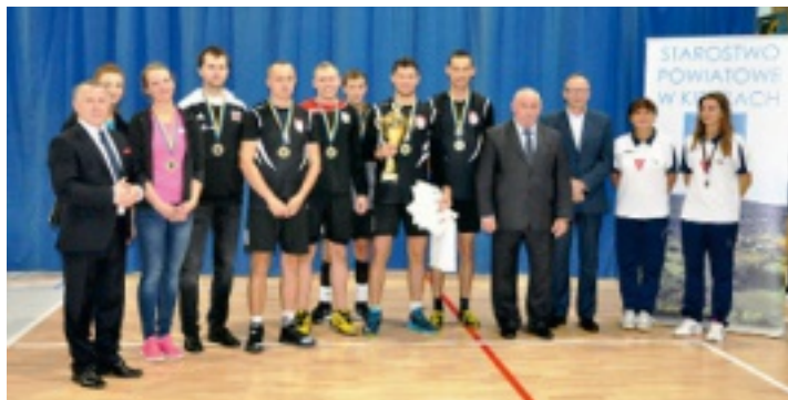
Siatkarze ze Strawczyna po raz drugi z rzędu zwyciężyli w Turnieju o Puchar Przewodniczącego Rady Powiatu w Kielcach.

Reprezentacja Gminy Strawczyn zwyciężyła w VI Powiatowym Turnieju Piłki Siatkowej o Puchar Przewodniczącego Rady Powiatu w Kielcach, który został rozegrany 22 października 2016 r. w Zagnańsku.