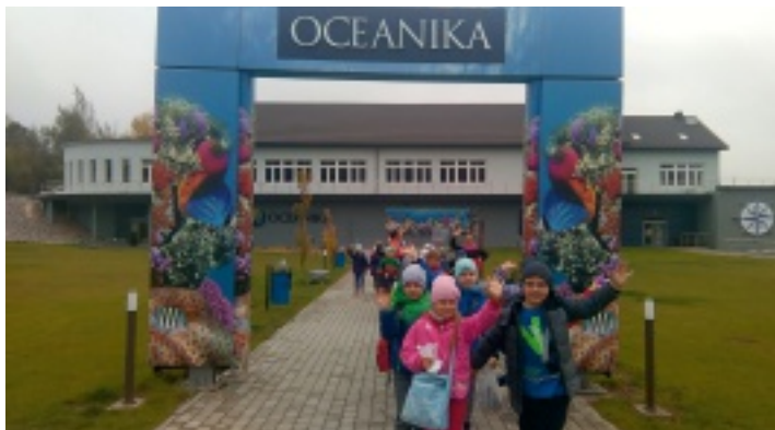
Uczniowie ze Strawczyna odwiedzili oceanarium.

19 października 2016 r. uczniowie klas drugich Szkoły Podstawowej w Strawczynie wyjechali na wycieczkę do Kompleksu Świętokrzyska Polana w Chrustach k/Zagnańska. Dzięki wizycie w Oceanarium dzieci miały okazję poznać tajemniczy i przepiękny świat głębin mórz i oceanów całego świata oraz różne gatunki stworzeń w nich żyjących.