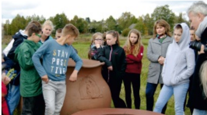
Wizyta w Szkole Wrażliwości w Kapkazach.

Uczniowie Zespołu Placówek Oświatowych w Oblęgorku dzięki zaproszeniu przez Fundację Studio TM w Kielcach mieli możliwość uczestniczenia w niezwykłym przedsięwzięciu, jakim było zadanie „Janko Muzykant Modern” w ramach projektu Świętokrzyska Akademia Edukacji Kulturowej. Przedsięwzięcie zostało dofinansowane ze środków Narodowego Centrum Kultury w ramach Programu Bardzo Młoda Kultura 2016-2018.