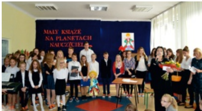
Uczniowie ze Strawczyna z okazji Dnia Nauczyciela przygotowali przedstawienie "Mały Książę na planetach nauczycieli."

17 października w Zespole Placówek Oświatowych w Strawczynie świętowano Dzień Edukacji Narodowej. Na tę wyjątkową okazję uczniowie klas V a szkoły podstawowej oraz III b gimnazjum przygotowali pod kierunkiem A. Szyszki oraz E. Dębickiej-Szmidt przedstawienie pt. „Mały Książę na planetach nauczycieli”.