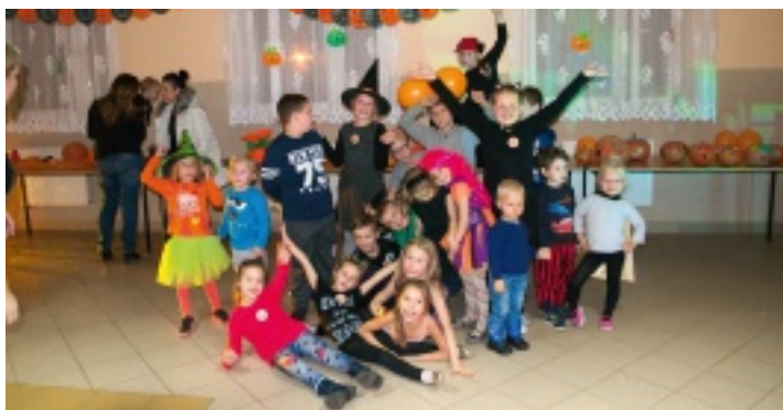
Na balu w Strawczyni królowała dynia.

28 października 2016 r. z okazji Święta Dyni Samorządowe Centrum Kultury i Sportu zorganizowało w świetlicy w Strawczyni bal przebierańców. Tego dnia na sali, gdzie dominował kolor pomarańczowy i dynie zrobione przez dzieci podczas zajęć świetlicowych, pojawiły się bajkowe postacie. Można było spotkać kota, wróżki, motyla, pirata i wiele innych ulubionych dziecięcych bohaterów.