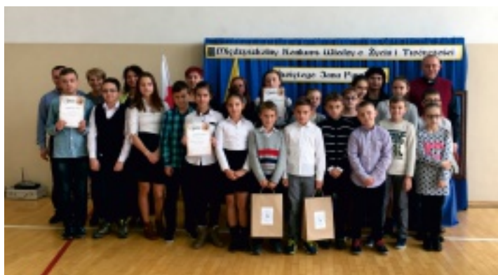
Uczestnicy konkursu wraz z opiekunami.

28 października 2016 w Szkole Podstawowej im. Jana Pawła II w Korczynie po raz kolejny odbył się konkurs wiedzy o życiu i twórczości papieża Polaka.