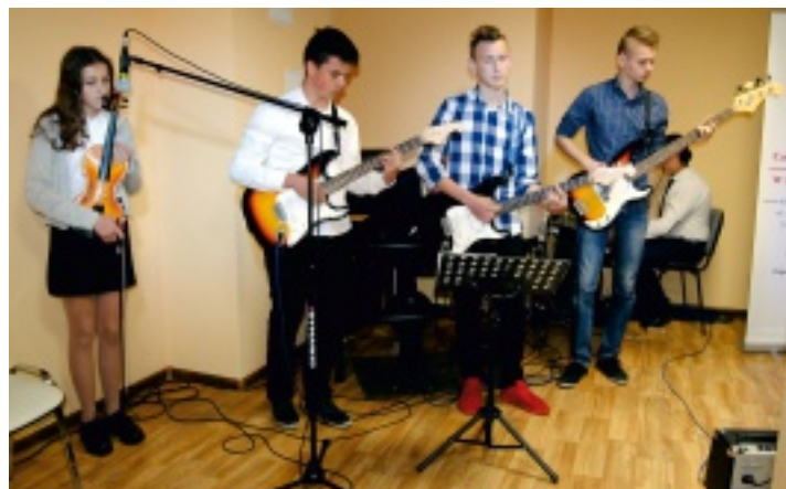
Zespół złożony z uczniów i absolwentów ZPO w Oblęgorku zagrał w hospicjum bł. Matki Teresy z Kaluty w Kielcach.

18 października 2016 r. odbył się happening „Nie marnuj jedzenia w szkole” z racji kolejnego Światowego Dnia Żywności. Impreza miała miejsce w Galerii Echo w Kielcach. Na scenie z 30-minutowym występem zaprezentował się również zespół wokalnie-instrumentalny z na-