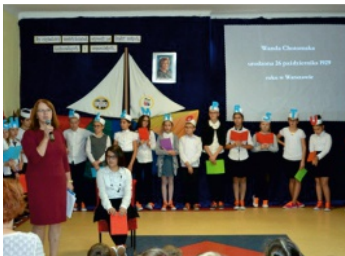
Podczas "Tygodnia z Wandą Chotomską" uczniowie z ZPO w Strawczynie mieli okazję lepiej poznać twórczość popularnej polskiej pisarki.

W ramach „Narodowego Programu Rozwoju Czytelnictwa” w Zespole Placówek Oświatowych w Strawczynie zorganizowany został w dniach 24-28 października 2016 r. „Tydzień z Wandą Chotomską”. Centralną jego postacią była oczywiście ta znana współczesna pisarka, autorka wierszy i opowiadań dla dzieci oraz młodzieży, która 26 października obchodziła swoje 87. urodziny.