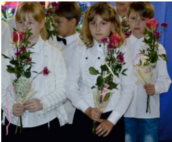
Uczniowie SP w Chełmcach wręczali nauczycielom kwiaty.

W tradycji szkolnej Dzień Edukacji Narodowej to radosne święto nauczycieli i pracowników oświaty. Z tej okazji 13 października 2016 r. w sali gimnastycznej Szkoły Podstawowej w Chełmcach odbyła się uroczysta akademia.