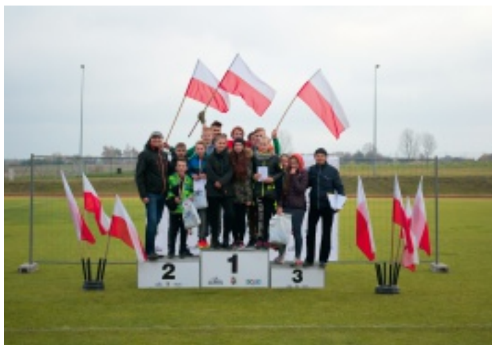
Na stadionie w Strawczynku dominowały biel i czerwień.

9 listopada 2016 r. w Strawczynku odbył się już VIII Bieg Niepodległości o Miłą Strawczyńską. Zawody zgromadziły na stadionie Centrum Sportowo-Rekreacyjnego OLIMPIC blisko dwustu uczniów z piętnastu szkół podstawowych i gimnazjów.