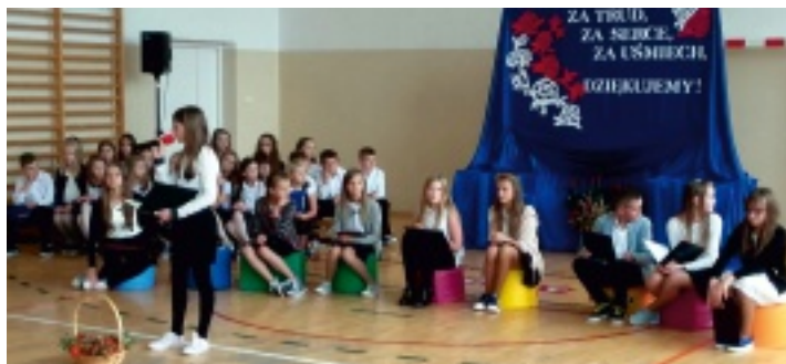
Dzieci z SP w Korczynie podziękowały nauczycielom za trud włożony w ich wychowanie.

13 października 2016 r. w Szkole Podstawowej im. Jana Pawła II w Korczynie odbyła się uroczystość z okazji dnia Edukacji Narodowej, na którą przybyli nauczyciele, pracownicy szkoły i rodzice.