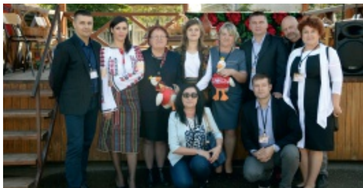
Nauczyciele z Oblęgorka w ramach programu Erasmus+ poznali system edukacji w Rumunii.