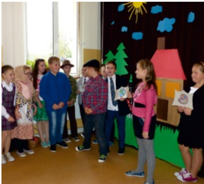
Uczniowie SP w Rudzie Strawczyńskiej z okazji Dnia Nauczyciela przygotowali specjalny program artystyczny.

Dzień Edukacji Narodowej to szczególne święto wszystkich nauczycieli i pracowników oświaty. Z tej okazji od wielu lat uczniowie składają życzenia swoim nauczycielom. Jak co roku 13 października 2016 r. w Szkole Podstawowej w Rudzie Strawczyńskiej odbyła się uroczysta akademia z okazji Dnia Edukacji Narodowej pod hasłem: „Wszystko nas dziś rozwesela, bo jest Dzień Nauczyciela”.