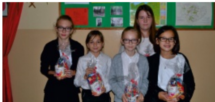
Pięć uczennic z SP w Niedźwiedziu wzięło udział w konkursie ekologicznym organizowanym przez UG w Strawczyźnie.

Uczniowie Szkoły podstawowej w Niedźwiedziu po raz kolejny wzięli udział w konkursie ekologicznym organizowanym przez Urząd Gminy Strawczyn. Tym razem odbywał się on pod hasłem: „Drzewo – przyjaciel człowieka”.