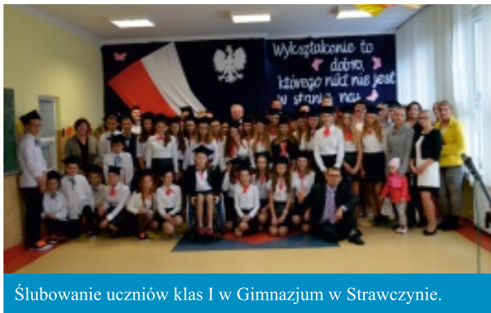
Ślubowanie uczniów klas I w Gimnazjum w Strawczynie.

25 października w świetlicy szkolnej Zespołu Placówek Oświatowych w Strawczynie miała miejsce uroczystość ślubowania uczniów klas pierwszych gimnazjum. Przyświecało jej wymowne hasło: „Wykształcenie to dobro, którego nikt nie jest w stanie nas pozbawić”.