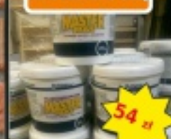
Masa szpachlowa MASTER MAS 25kg