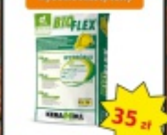
KERAKOLL BIO FLEX 2-czlowy 1kg wysokielastyczny