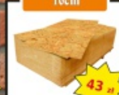
Płyta OSB 10cm