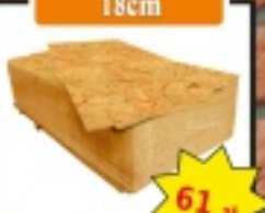
Płyta OSB 18cm