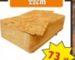
Płyta OSB 22cm