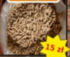
Pellet dębowy 5mm worek 15kg