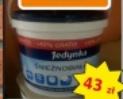
Farba emulsyjna 1 l JEDYNKA