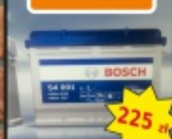
Akumulatory BOSCH S4