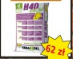
KERAKOLL H40 NO LIMITS 1kg w słoiku