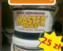
Masa szpachlowa MASTER MAS 9kg