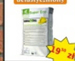
KERAKOLL SUPER ECO uelastyczniony