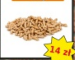
Pellet iglasty 6mm worek 20kg