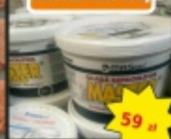
Masa szpachlowa MASTER MAS 25kg