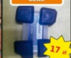
Kpl. bostek do fug i silikonów BEKO