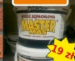
Masa szpachlowa MASTER MAS 9kg