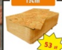
Płyta OSB 15cm