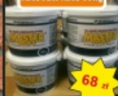
Masa szpachlowa MASTER MAS 35kg