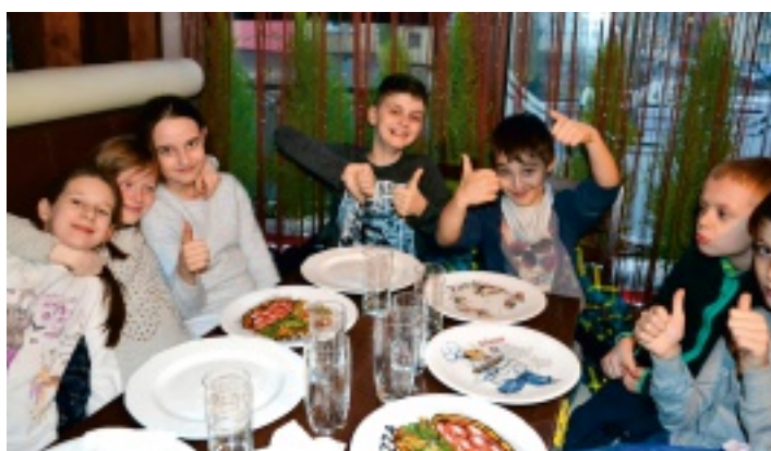
Wyjazd do kina i poczęstunek ufundował Urząd Gminy w Strawczyнку.