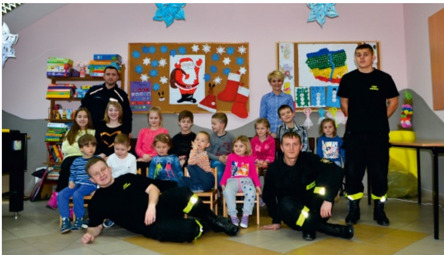
W ferie prócz gier i zabaw na świetlicach SCKiS odbyły się także szkolenia z zakresu pierwszej pomocy i bezpieczeństwa na drodze.