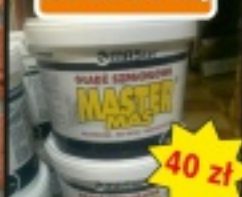
Masa szpachlowa MASTER MAS 18kg