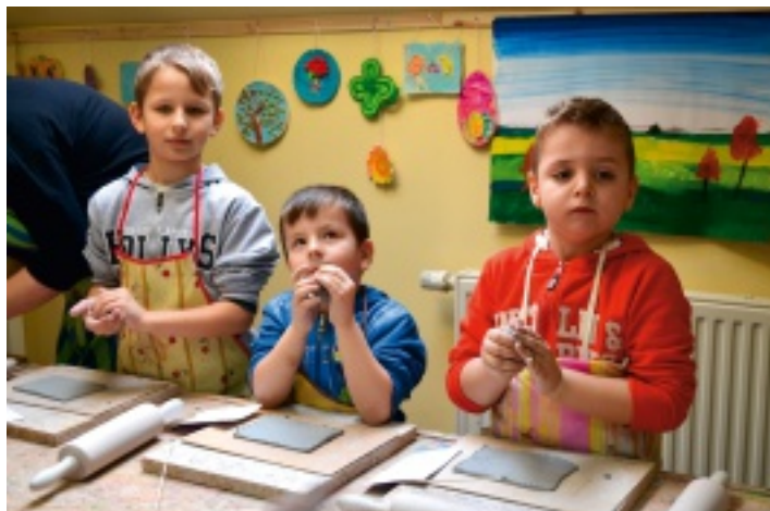
Zajęcia w pracowni ceramicznej w Strawczyнку zawsze cieszą się dużą popularnością.

Dzieciaki mogły również wziąć udział w różnego rodzaju warsztatach, grach elektronicznych, stolikowych,