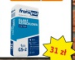
Gładź szpachlowa FRANSPOL 20kg