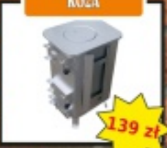
Piec chłodziwy KOZA