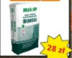
Gładź szpachlowa NIDA OMEGA 20kg