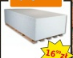
Płyta g-k biała