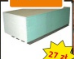
Płyta g-k zielona