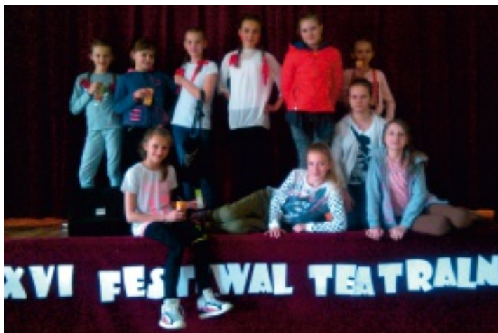
Sztuka "Zażegnania" dała kołu teatralnemu ze Szkoły Podstawowej w Korczynie 3 miejsce.

Grupa teatralna ze Szkoły Podstawowej im. Jana Pawła II w Korczynie wzięła udział w XVI Festiwalu Teatralnym, który odbył się 14 kwietnia 2016 r. w Centrum Kultury w Piekoszowie. Tym razem tematem spotkania były „Podania, legendy i obrzędy związane z regionem świętokrzyskim”.