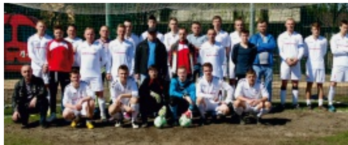
Zespół Topspin Promnik przed meczem z LKS Bolmin.

Grający w drugiej grupie klasy B zespół piłkarski Topspin Promnik po 18. kolejce rozgrywek sezonu 2015/2016 z 28 pkt. zajmuje 5. miejsce w tabeli ze stratą 14 pkt. do lidera.