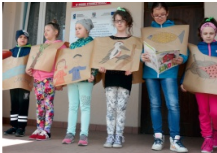
Dzień Ziemi to znakomita okazja do edukacji ekologicznej.

22 kwietnia 2016 r. obchodziliśmy Dzień Ziemi. W Polsce obchodzony od 1990 r., a na świecie już od 1970 r.. W tym dniu uczniowie Szkoły Podstawowej w Rudzie Strawczyńskiej wraz z dyrekcją i gronem pedagogicznym obejrżeli krótki występ uczniów klasy II i V pod hasłem „Ratujmy przyrodę”.