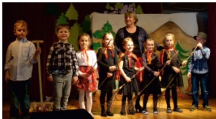
Dla młodych aktorów z Oblęgorka był to debiut sceniczny.

Uczniowie klasy I b Szkoły Podstawowej im. Henryka Sienkiewicza w Oblęgorku uczestniczyli w XVI Festiwalu Teatralnym pod hasłem „Podania, legendy i obrzędy związane z regionem świętokrzyskim”. Festiwal odbył się 14 kwietnia 2016 roku w Centrum Kultury w Piekoszowie, a zorganizował go Zespół Oświatowych Placówek Integracyjnych w Micigoździe.