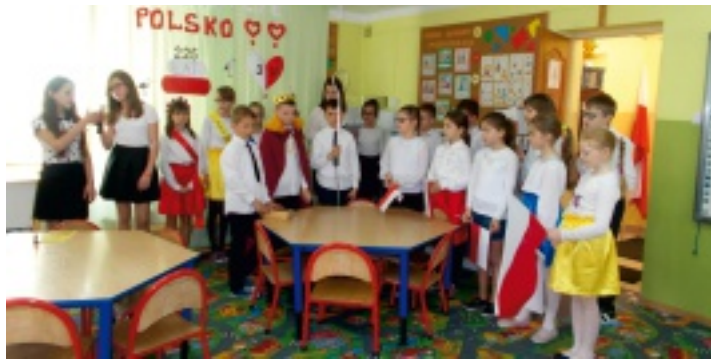
Scena zaprzysiężenia Konstytucji 3 Maja.

Dnia 28 kwietnia 2016 r. w Szkole Podstawowej w Niedźwiedziu odbyła się akademie z okazji 225. rocznicy uchwalenia Konstytucji Trzeciego Maja. Klasa IV i V przedstawiła program artystyczny, który składał się z krótkich scenek historycznych oraz wierszy i piosenek.