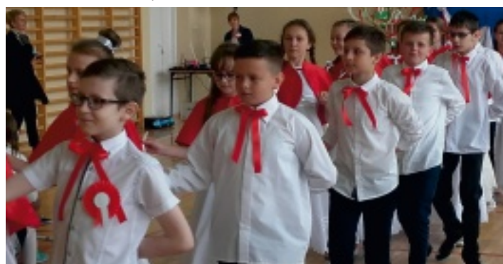
Uczniowie klasy piątej tańczą poloneza.

4 maja 2016 r. uczniowie Szkoły Podstawowej im. Jana Pawła II w Korczynie uczcili 225. rocznicę uchwalenia pierwszej polskiej konstytucji. W tym dniu odświętnie ubrana społeczność szkolna, ozdobiona biało-czerwonymi kotylicjami, zebrała się w sali gimnastycznej. Tam młodzi artyści z klasy czwartej i piątej tańcem, słowem i piosenką mieli przybliżyć dawne wzniosłe wydarzenia.