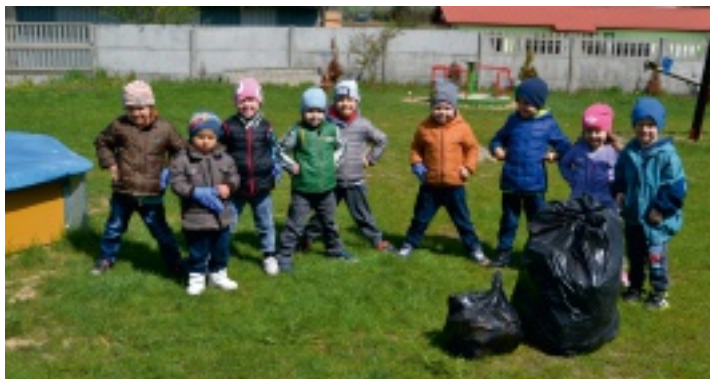
Maluchy ze Stawczynka w ramach "Dnia Ziemi" pomagały sprzątać teren wokół przedszkola.

22 kwietnia 2016 r. pięknym wierszem opowiadającym o naszej planecie przedszkolaki ze Stawczynka rozpoczęły uroczysty dzień – Międzynarodowy Dzień Ziemi.