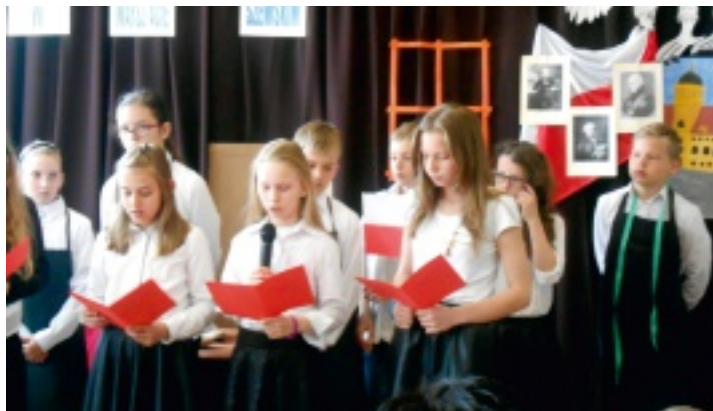
Podczas uroczystej akademii uczniowie z Rudy Strawczyńskiej odśpiewali pieśń "Witaj, majowa jutrzhenko".