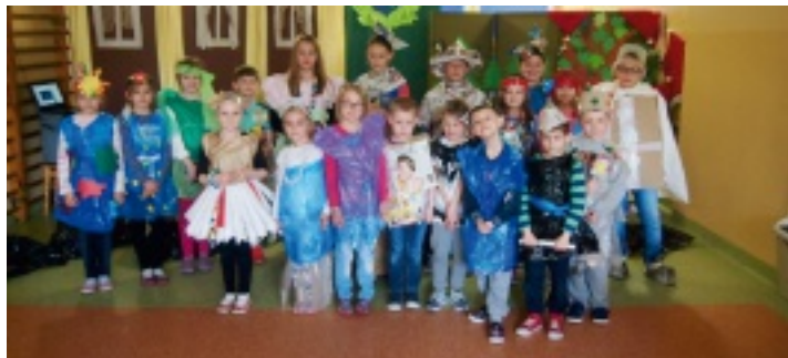
Uczniowie SP w Chełmcach z okazji Dnia Ziemi przygotowali pokaz ekologicznej mody.

Światowy Dzień Ziemi to największe ekologiczne święto świata. Obchodzone było po raz pierwszy w Stanach Zjednoczonych 22 kwietnia 1970 r., a w Polsce w 1990 r. Ten dzień przypomina nam, że musimy chronić nasze środowisko, bo jesteśmy częścią przyrody i bez niej nie możemy egzystować.