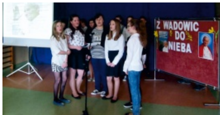
Podczas uroczystego apelu uczennice klas V i VI zaśpiewały m.in. "Barkę".

W poniedziałek, 25 kwietnia 2016 r., uczniowie i nauczyciele Szkoły Podstawowej w Chełmcach zgromadzili się na apelu, aby uczcić jedenastą rocznicę śmierci i drugą rocznicę kanonizacji Jana Pawła II.