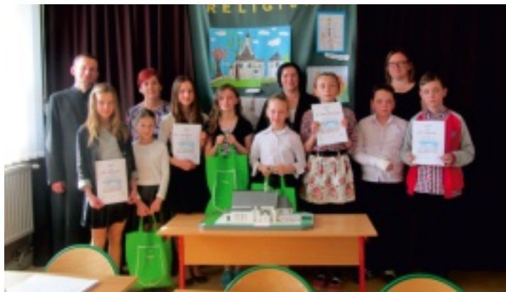
Uczestnicy konkursu religijnego w Rudzie Strawczyńskiej.

Każdego roku wiosną w Szkole Podstawowej w Rudzie Strawczyńskiej odbywa się konkurs religijny. W 1050 rocznicę chrztu Polski uczniowie pochwalili się swoją wiedzą z zakresu historii architektury oraz przeznaczenia i znaczenia różnych elementów kościoła.