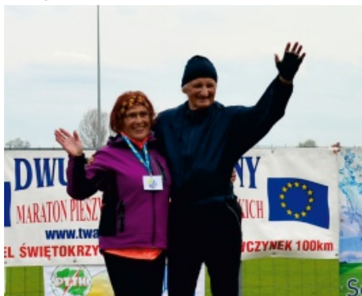
Najstarsi zawodnicy Rajdu kondycją mogliby zawstydzić niejednego "młodzika".

Już po raz XII odbył się Unijny Maraton Pieszcy po Górach Świętokrzyskich organizowany w rocznicę przyjęcia Polski do Unii Europejskiej. Tradycyjnie Oddział Świętokrzyski Polskiego Towarzystwa Turystyczno-Krajoznawczego zorganizował trzy imprezy ze wspólnym zakończeniem na terenie Centrum Sportowo-Rekreacyjnego OLIMPIC w Strawczynku. Łącznie blisko 350 osób z całej Polski wędrowało 30 kwietnia i 1 maja 2016 r. po czerwonym szlaku turystycznym im. Edmunda Masalskiego.