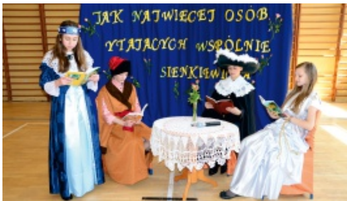
Uczniowie z Oblęgorka czytali swoje ulubione fragmenty z utworów Henryka Sienkiewicza.

5 maja 2016 r. o godz. 10.00 wszyscy uczniowie i nauczyciele ZPO w Oblęgorku włączyli się w ogólnopolską akcję Ustanowienia Rekordu Polski w kategorii „jak najwięcej osób czytających wspólnie Sienkiewicza”.