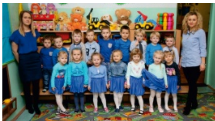
Przedszkolaki z Chełmiec zdobyły ponad dwadzieścia tysięcy głosów.

Od 12 do 29 kwietnia 2016 r. na stronie internetowej gazety Echo Dnia prowadzony był konkurs na najsympatyczniejsze grupy przedszkolne z terenu powiatu kieleckiego. Do konkursu przystąpiło 241 przedszkoli. Tematem przewodnim był zdrowy styl życia dzieci.