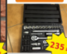
Kit Klucze Nasadowych COVAL 75 EL