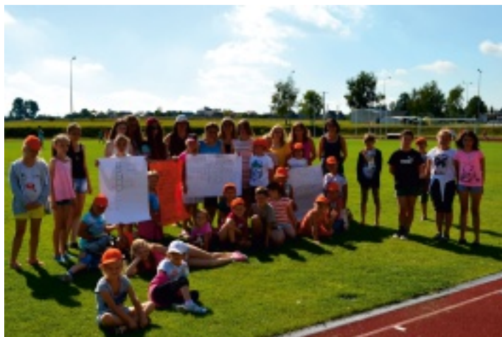
Duża część zajęć odbyła się na terenie Centrum Sportowo-Rekreacyjnego OLIMPIC w Strawczynku.

75 dzieci wzięło udział w dwutygodniowych półkoloniach letnich, zorganizowanych przez Samorządowe Centrum Kultury i Sportu w Strawczynie, które odbyły się w dniach od 25 lipca do 5 sierpnia 2016 r. Program zajęć realizowany był od poniedziałku do piątku w godzinach od 9:00 do 15:00. Dzieci każdego dnia miały obiad przygotowany w hotelu „Szafranowy Dwór” oraz coś na słodko i coś do picia.