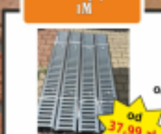
Kratka Odpływowa 1M