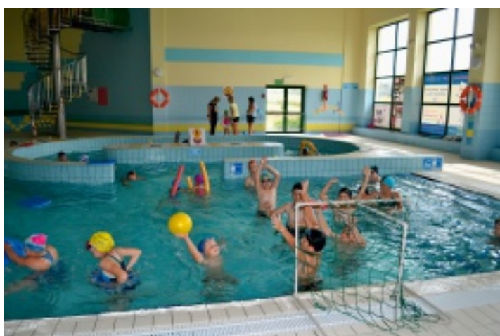
Jak co roku w ramach półkoloni odbyły się zajęcia na pływalni OLIMPIC w Strawczynku.