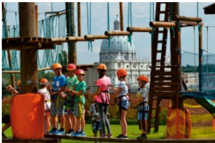
W Parku Rozrywki i Miniatur Sabat Krajno dzieci obejrzały budowle z całego świata oraz sprawdziły swoją sprawność.