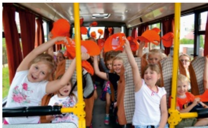
Autokar na wycieczki udostępnił Urząd Gminy w Strawczynie.