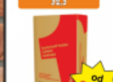
Cement Czerwony 32,5