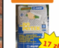
Klej do Płytek GLAZURNIK