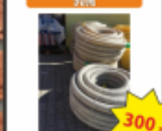
Rura Drenarska w Geowłókninie 50M