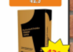
Cement Czarny 42,5