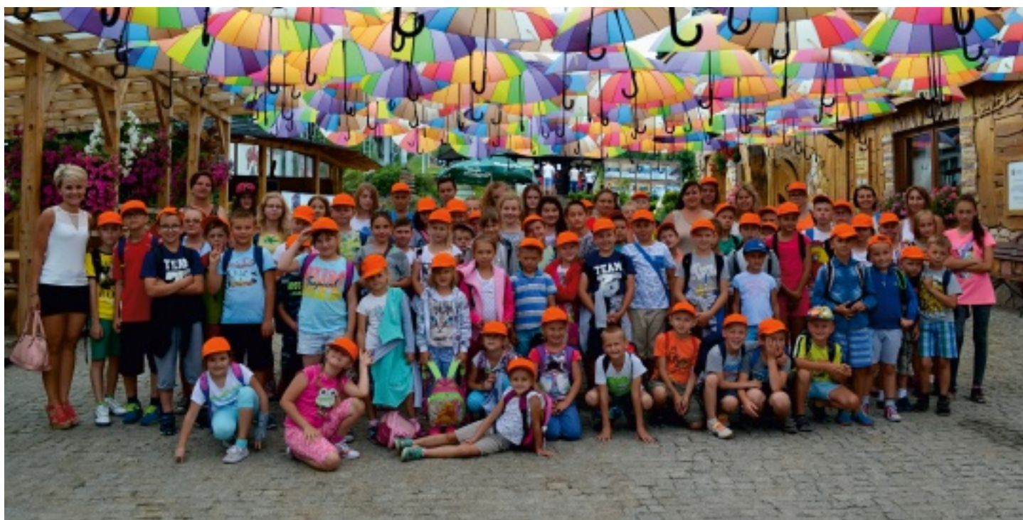
W półkoloniach wzięło udział 75 dzieciaków.