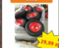
Koło do Taczki + Ośka