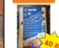
Klej do Płytek ADESILEX