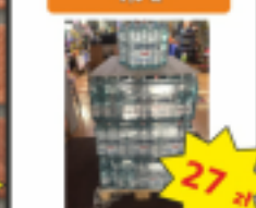
Woda Cisowianka 1,5 L