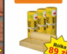
Włna UNIMATA Rolka ISOVER