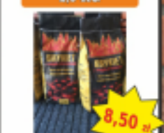
Brykiet Drzewny 2,5 KG