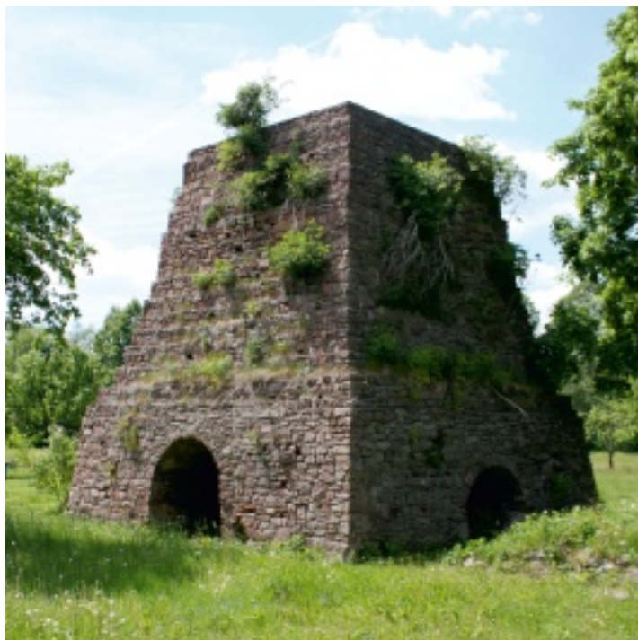
W XVIII wieku w Kuźniakach pracował najmniejszy z ówczesnych 34 wielkich pieców na ziemiach polskich.

Już w średniowieczu w okolicach Kuźniaków wytapiano żelazo w piecach dymarkowych.