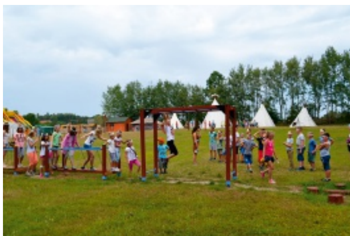
W indiańskiej wiosce "Bonanza" w Iwaniskach każdy otrzymał indiańskie imię.