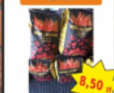
Węgiel Drzewny 2,5 KG