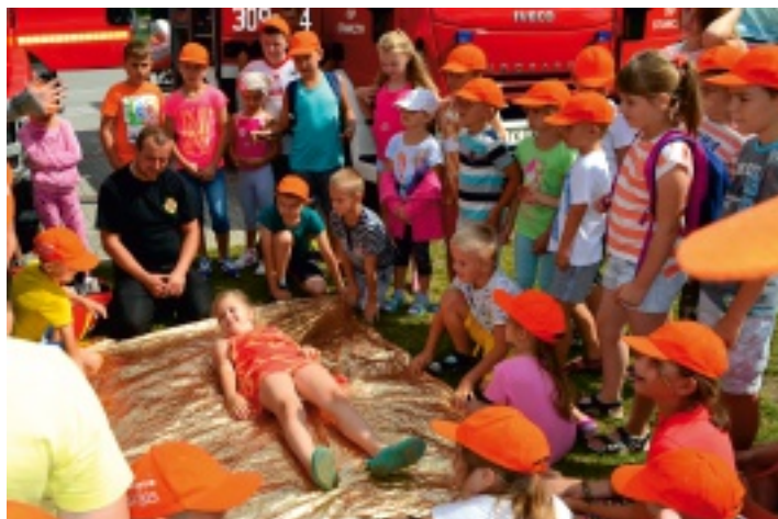
Strażacy ze Strawczyna przeszkolili półkolonistów z zakresu udzielania pierwszej pomocy przedmedycznej.