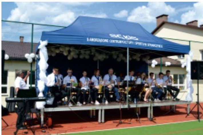
W Chelmcach wystąpiła orkiestra dęta ze Strawczyna.

W niedzielę, 24 lipca 2016 r., na boisku szkolnym w Chelmcach już po raz trzeci odbył się festyn sołecki.