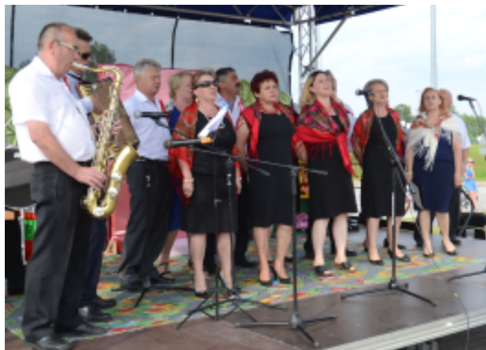
Zespół ludowy "Swojaki" działa już od ponad roku.