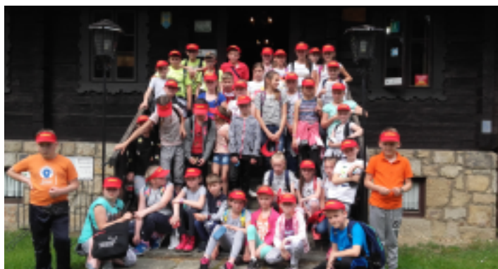
Uczestnicy wycieczki w Beskid Śląski.

W ostatnich dniach maja i na początku czerwca 2017 r. uczniowie klas III-VI Szkoły Podstawowej im. Jana Pawła II w Korczynie wyjechali na trzydniową wycieczkę w Beskid Śląski.