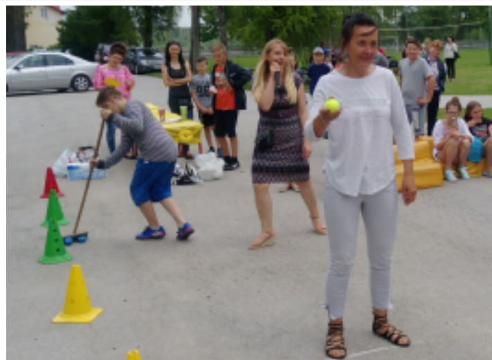
W SP Rudzie Strawczyńskiej Mamy mogły wygrać "Złote Losy", czyli pomoc dzieci w pracach domowych.