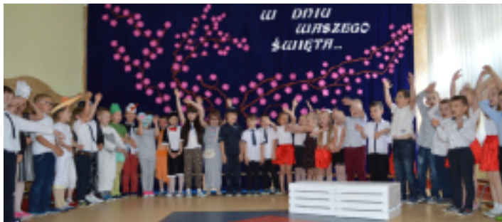
Uczniowie ZPO w Strawczynie przygotowali niespodzianki dla Mam.

Wśród bogatego wachlarza tematów podejmowanych w wierszach i piosenkach, tych sprzed lat, jak i obecnych, jest jeden, który jak złota nić przewija się i ozdabia ten wachlarz, czyniąc go wydatnie bogatszym. A chociaż temat ten zamyka się w jednym tylko słowie – MATKA – to ileż kryje ono w sobie treści.