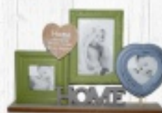
RAMKA STOJĄCA 49 ZŁ