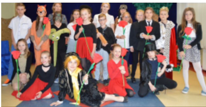
Jednym z motywów współpracy była książka "Mały Książę".