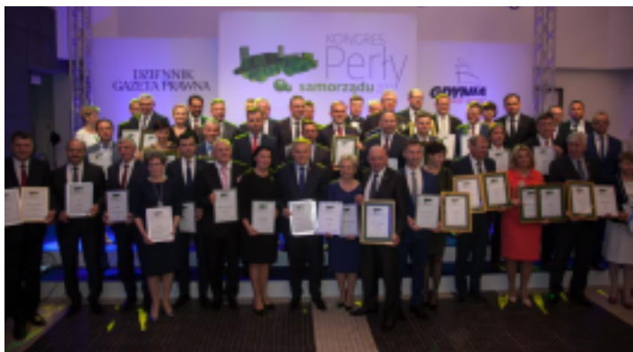
Uroczysta gala wręczenia "Perły Samorządu" odbyła się 25 maja 2017 r. w Muzeum Emigracji w Gdyni.