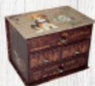
KARTONWA SZKATUŁKA 35 ZŁ