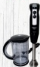
BLENDER ZELMER 160 ZŁ