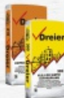
KLEJ DO SIATKI/STYROPIANU DREIER 310 20 ZŁ. ZAPRAWA MURARSKA DREIER 310 11 ZŁ.