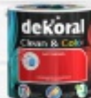
FARBA DEKORAL CLEAN&COLOR 2,5L 59 ZŁ.