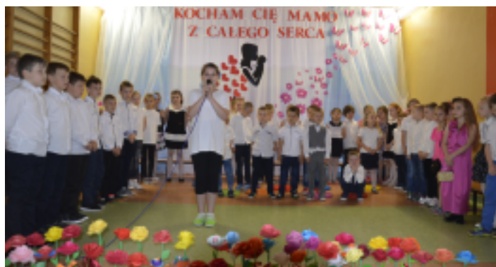
Uczniowie z SP w Chełmcach przygotowali dla mam specjalny program artystyczny.