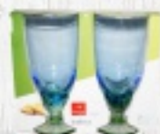
PUCHARKI DO LODÓW 24 ZŁ