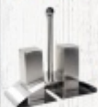
PRZYPRAWNIK 32 ZŁ