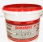
GRUNT SUPER MATT BORAMAX 10 KG 69 ZŁ.