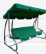
HUŚTAWKA OGRODOWA RELAX 299 ZŁ.