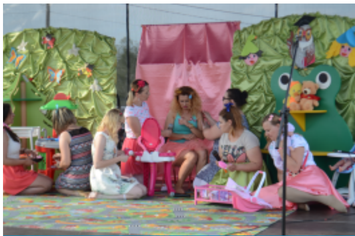
Przedszkolanki wcieliły się postaci swoich małych podopiecznych.

Po występach solistów oraz sekcji gitarowej SCKiS