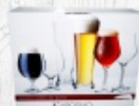
ZESTAW SZKIEŁ DO PIWA KROSNO 49 ZŁ