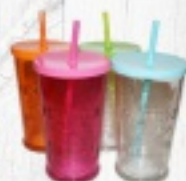
KUBKI ZE SŁOMKĄ 5,20 ZŁ