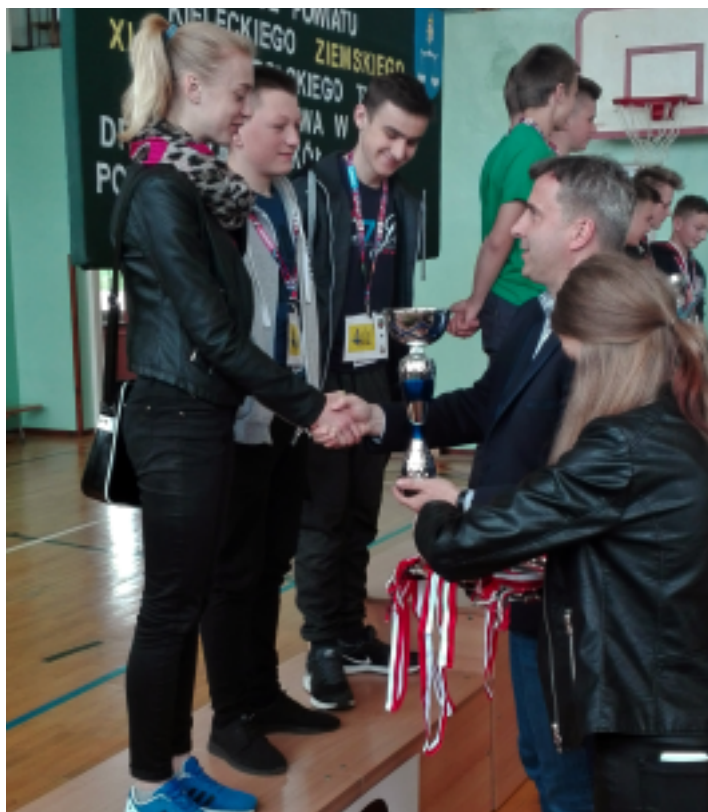
Uczniowie z Oblęgorka zajęli II miejsce w Turnieju.