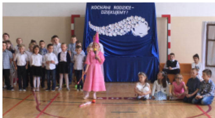
Dzień Mamy i Dzień Taty w Szkole Podstawowej w Korczynie.

Zadeklamowane wierszyki, wyśpiewane z serca piosenki oraz piękny układ taneczny wywołały u rodziców łzy wzru-