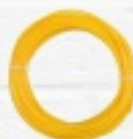
ŻYŁKA DO PODKASZARKI od 5 zł