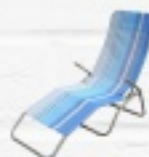
LEŻAK PLAŻOWY 95 ZŁ.