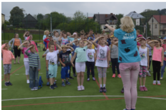
Z okazji Dnia Dziecka w Szkole Podstawowej w Chełmcach zabawę poprowadziła grupa animacyjna "Art Smile".

Po grillowym obiedzie i kilkunastominutowej przerwie, uczniowie w dwóch grupach wiekowych oglądali filmy. To był