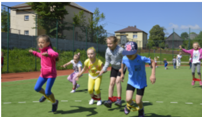
Dzień sportu w SP w Chełmcach.

1 czerwca 2017 r. w Szkole Podstawowej w Chełmcach po raz kolejny odbył się Dzień Sportu Szkolnego. W programie imprezy znalazły się konkurencje sportowe dla dwóch grup wiekowych. Każdy uczeń z poszczególnej klasy musiał wykonać zadania przy pięciu różnych stanowiskach.