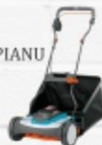
KOSIARKA BĘBNOWA GARDENA 380 LI 999 ZŁ.