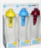
BUTELKI FILTRUJĄCE DAFI 32 ZŁ