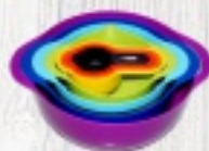
ZESTAW MISEK, MIAREK I SITEK 44 ZŁ