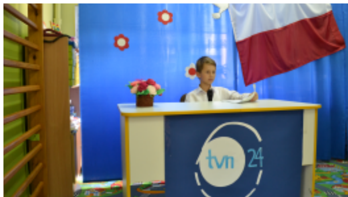
Wydarzenia z 1791 r. zostały przedstawione w formie serwisu informacyjnego.