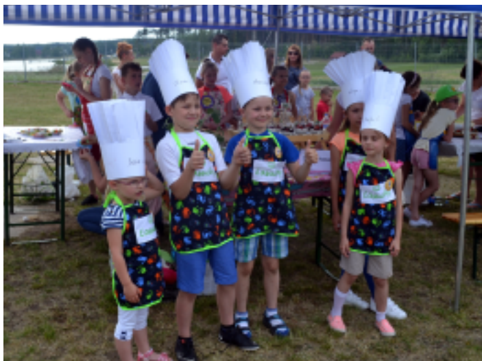
W zmaganiach kulinarnych "Świetlicowy Master Chef" zwyciężyła drużyna "Łasuchy" ze Strawczyna.