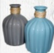
WAZON MAŁY 18,50 ZŁ DUŻY 27 ZŁ