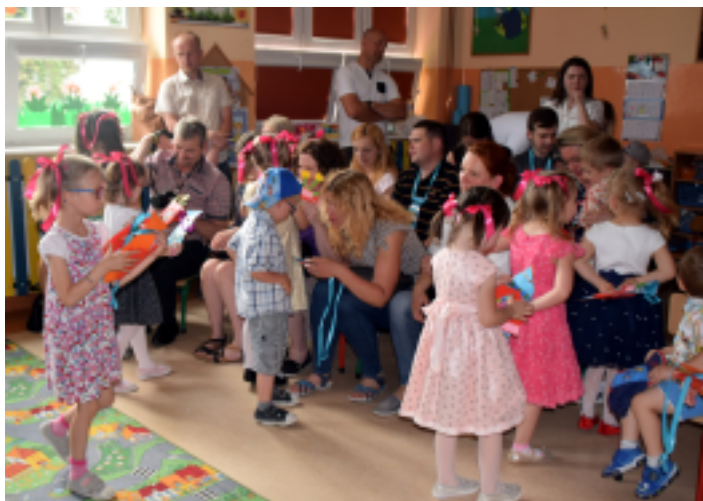
Przedszkolaki przygotowały dla Rodziców upominki.

Przedszkolaki po uroczystości wręczyły Rodzicom prezenty, po czym nastąpiła najbardziej wyczekiwana część spotkania. Wszyscy Rodzice i Dzieci w tym wyjątkowym dniu bawili się wesoło razem w kole. Był Taniec z Tatą, konkurencja