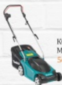
KOSIARKA ELEKTRYCZNA MAKITA ELM3711 560 ZŁ.