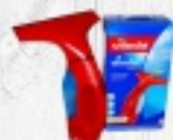
ŚCIĄGACZKA ELEKTRYCZNA VILEDA 235 ZŁ