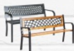
ŁAWKA OGRODOWA GRANADA 215 ZŁ. RUSTON 199 ZŁ.