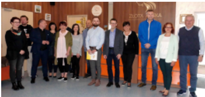
Żłotą Rybkę odwiedziło wielu znamienitych gości.

Czas majówki zawitał również do Świętokrzyskiego Centrum Rehabilitacji i Terapii Żłota Rybka w Obłęgorku. 13 maja spotkaliśmy się na pikniku rodzinnym „Dzień Otwarty ze Żłotą Rybką”. Impreza zorganizowana była we współpracy ze Stowarzyszeniem Projekt Świętokrzyskie