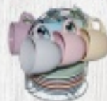
ZESTAW FILIŻANEK ZE SPODKAMI NA STOJAKU 59 ZŁ