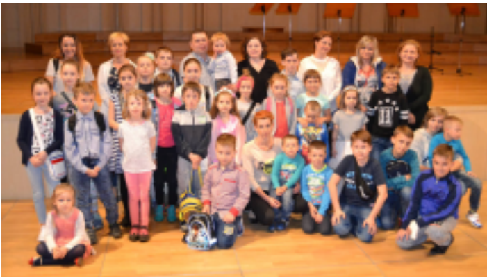
Dzieci ze świetlic SCKiS w Filharmonii Świętokrzyskiej.

W niedzielne przedpołudnie, 21 maja 2017 r., Samorządowe Centrum Kultury i Sportu w Strawczynie zorganizowało dla dzieci i ich rodziców wyjazd na koncert familijny do Filharmonii Świętokrzyskiej na koncert familijny.