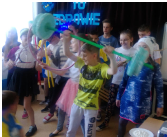
Najwięcej emocji wzbudziła prezentacja podnoszenia ciężarów.

Uczniowie w trakcie przedstawienia czytali wiersze o różnych dyscyplinach sportowych. Za każdym razem w odpowiednich strojach i z stosownym sprzętem prezentowali swoje konkurencje. A były to między innymi: gra w piłkę nożną, koszykówka, bieg przez płotki, skok w dal, przeciąganie liny, jazda na rowerze, tenis ziemny, taniec towarzyski, gimnastyka, aerobik, skoki narciarskie, kajakarstwo, pływanie i wiele innych dyscyplin sportowych. Najwięcej emocji wzbudziła prezentacja podnoszenia ciężarów i wyczyny kierowcy rajdowego. Pokazy odbywały się przy odpowiednio dobranej muzyce. Wyświetlana była także przygotowana na tę okazję prezentacja multimedialna.