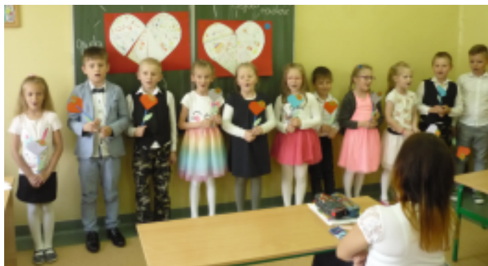
Dzień Mamy w Szkole Podstawowej w Niedźwiedziu.