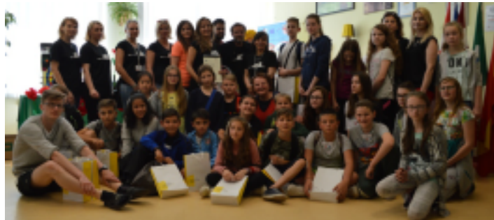
Uczestnicy projektu "We are cooperARTive".