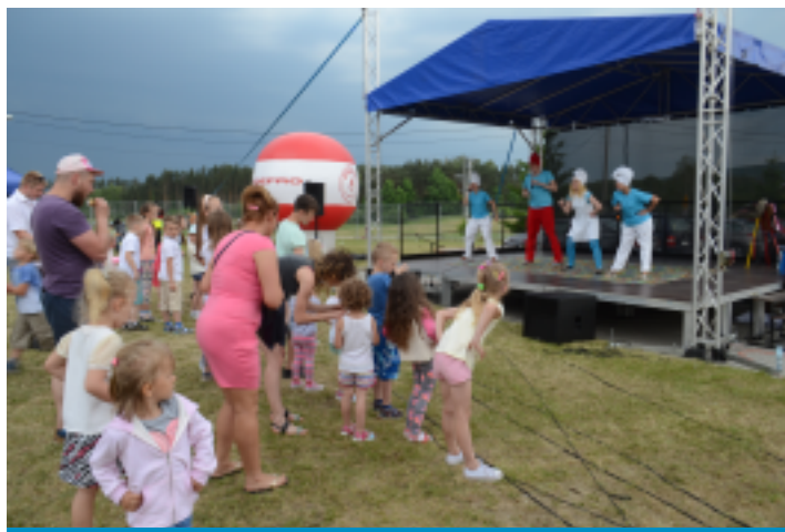
Zły Gargamel sprowadził na nasz piknik burzę...