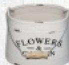
DONICZKA MAŁA 24 ZŁ DUŻA 31 ZŁ