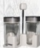
PRZYPRAWNIK 27 ZŁ