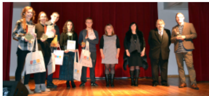
Przebieg przeglądu Miniatury Sceniczne w Bibliotece Centrum Kultury w Piekoszowie.

30 listopada 2017 r. w Bibliotece Centrum Kultury w Piekoszowie odbył się przegląd małych form teatralnych "Miniatury sceniczne" zorganizowany dla powiatu kieleckiego oraz miasta Kielc. Można było na nim zaprezentować teatr jednego aktora, monodram lub monolog.