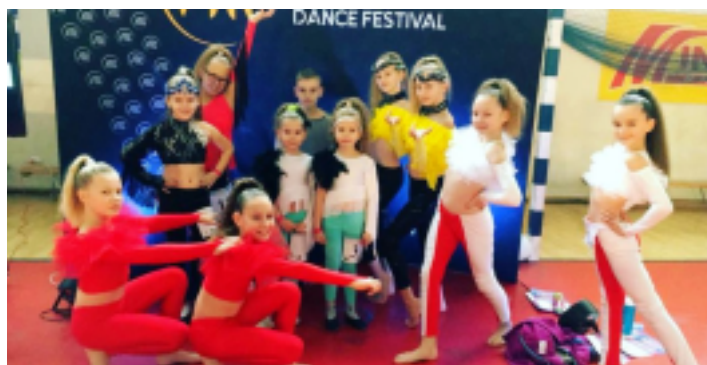
Reprezentacja OLIMPIC Dance Studio.

18 listopada 2017 r. dzieci trenujące taniec w prowadzonym przez Samorządowe Centrum Kultury i Sportu w Strawczynie OLIMPIC Dance Studio wzięły udział w zawodach International Dance Cup Karczew 2017.