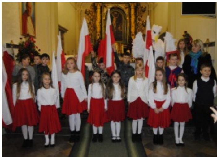
Uczniowie z Oblęgorka uczcili rocznicę odzyskania niepodległości występem w kościele w Chełmcach.