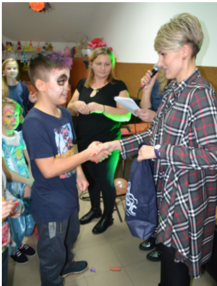
Nagrody zostały wręczone podczas zabawy andrzejkowej.