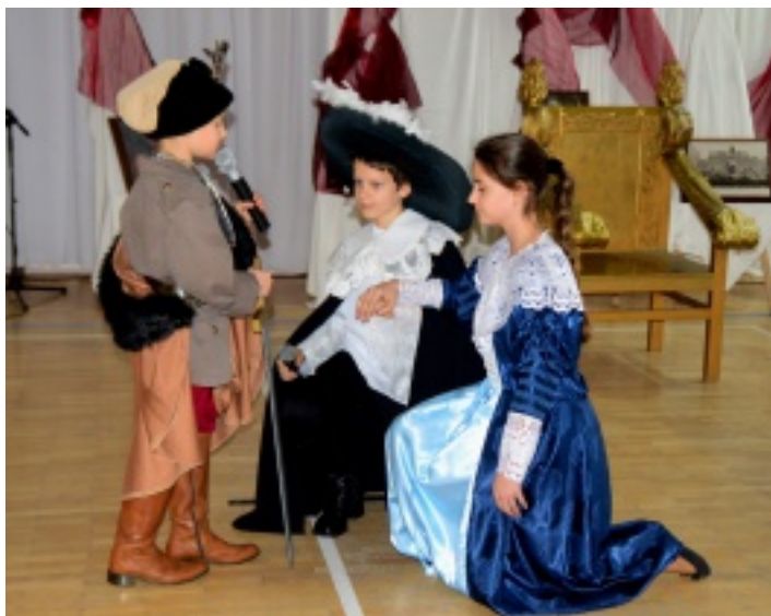
Uczniowie z Oblęgorka jako bohaterowie z kart powieści Henryka Sienkiewicza.

Dwa razy w roku, w rocznicę urodzin i w rocznicę śmierci Henryka Sienkiewicza, uczniowie szkoły w Oblęgorku uroczystie wspominają swojego Patrona.