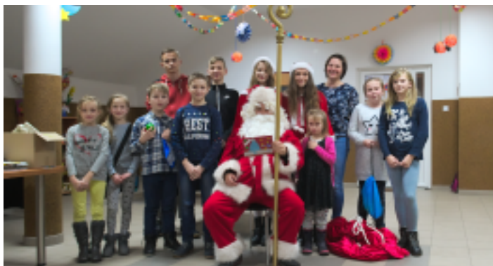
Wszystkie grzeczne dzieci otrzymały upominki.