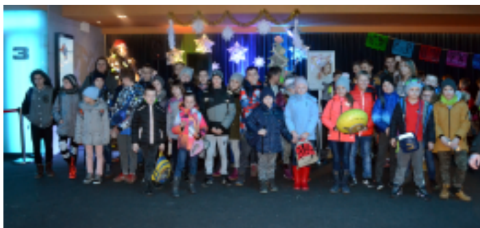
Dzieci obejrzały film animowany Pierwsza gwiazdka .

9 grudnia 2017 r. Samorządowe Centrum Kultury i Sportu w Strawczynie zorganizowało wyjazd do kina na seans Pierwsza Gwiazdka .