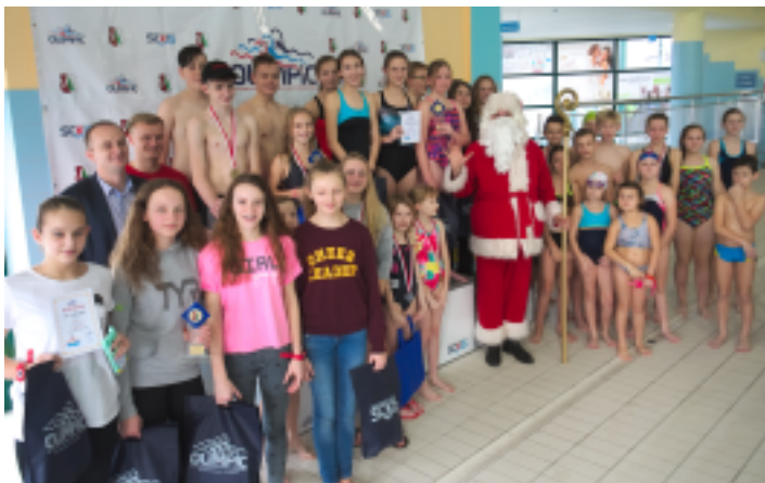
Nagrody wręczał Święty Mikołaj.

Już po raz piąty kryta pływalnia OLIMPIC zorganizowała Mikołajkowe Zawody Pływackie. 12 grudnia 2017 r. do Strawczynka zjechało kilkudziesięciu pływaków z ośmiu szkół podstawowych: z Kielec, Kostomłotów Drugich, Micigózd, Mniowa, Obłęgorka, Promnika, Rudy Strawczyńskiej i Strawczyna.