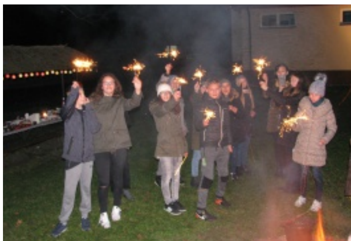
Tradycją "Bonfire Night" jest palenie ognisk i pokazy fajerwerków.

8 listopada Szkoła Podstawowa w Rudzie Strawczyńskiej zorganizowała kolejną imprezę kulturalną związaną z brytyjskim świętem ludowym zwanym „Bonfire Night” czyli „Spisek prochowy”. Każdego roku 5 listopada Anglicy obchodzą rocznice udaremnienia spisku prochowego z 1605 r., będącego zamachem na życie króla Anglii i Szkocji Jakuba I Stuarta.