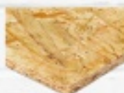
PEŁTY OSB 10 49 ZŁ 12 53 ZŁ 15 62 ZŁ 18 72 ZŁ 22 85 ZŁ