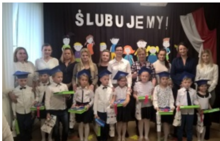
Pierwszoklasiści z Rudy Strawczyńskiej.

Uroczystość pasowania na ucznia to ważne wydarzenie w życiu każdego pierwszoklasisty. Ten piękny moment odbył się w naszej szkole 20 października 2017 roku. To wtedy przyjęto najmłodszych w poczet uczniów Szkoły Podstawowej w Rudzie Strawczyńskiej.