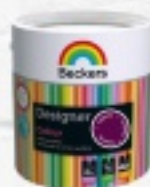
BECKERS DESIGNER COLOUR 2,5L 62 ZŁ 5L 99 ZŁ