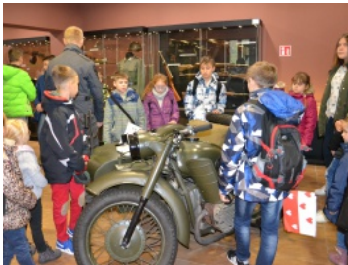
W muzeum znajduje się wiele eksponatów z czasów II wojny światowej.

11 listopada 2017 r. – w ramach obchodów Narodowego Święta Niepodległości – dzieci biorące udział w zajęciach na świetlicach prowadzonych przez Samorządowe Centrum Kultury i Sportu udały się na wycieczkę do Muzeum im. Orła Białego w Skarżysku-Kamiennej.