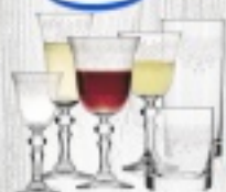
ZESTAW KROSNO PRESTIGE KRISTA 36 ELEMENTÓW 232 ZŁ