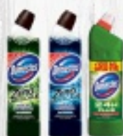
DOMESTOS RÓŻNE RODZAJE od 8 ZŁ