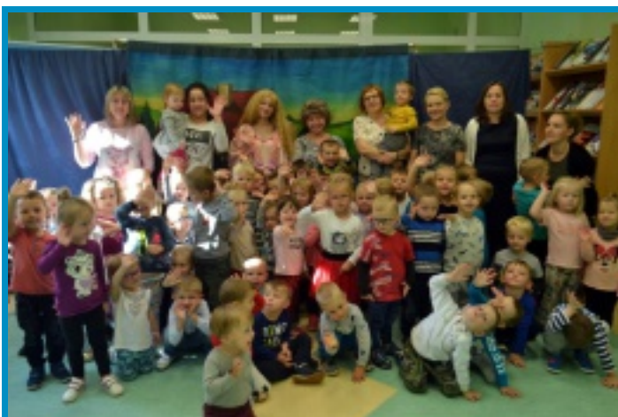
18 października 2017 r. w Gminnej Bibliotece Publicznej w Strawczyźnie gościł teatrzyk KRAK-ART ze spektaklem Dwie Dorotki .