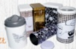
PUSZKA NA KAWĘ od 6 ZŁ