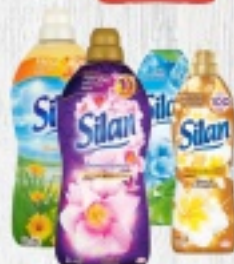
PEŁN DO PŁUKANIA SILAN 1L 9,90 ZŁ 2L 16 ZŁ