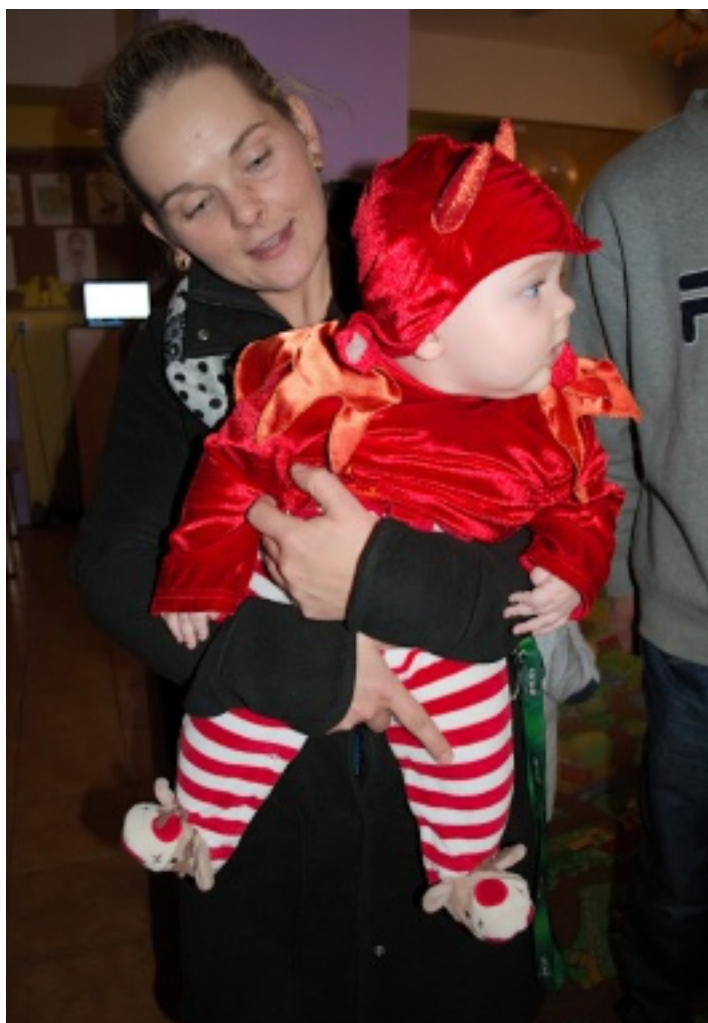
I dzieci i rodzice uwielbiają bale przebierańców.

Dzieci poprzebierane w różne postacie świetnie się bawiły pokazując na parkiecie wszystkie style tańca. Każdy mógł wziąć udział w konkursie tańca na gazecie czy z balonem, nikomu nie było straszne limbo i wszyscy zwinnie przechodzili pod liną. Chętnych też nie brakowało do udziału w quizie o bajkach i wszyscy zostali nagrodzeni drobnymi upominkami. Po wyczerpującej zabawie energię uzupełniona została przepyszными ciasteczkami dyniowymi, które przygotowały Panie z Koła Gospodyń Wiejskich z Chełmiec, za które serdecznie dziękujemy.