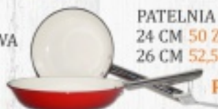
PATELNIĄ ŻELIWNĄ EMALIOWANĄ 24 CM 50 ZŁ 26 CM 52,50 ZŁ