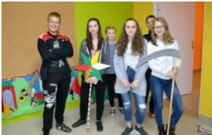
"Zamaskowani" szykują na swój debiut Jasełka.

Z początkiem września, w ramach zajęć na świetlicach prowadzonych przez Samorządowe Centrum Kultury i Sportu, zawiązało się koło teatralne „Zamaskowani”. Podczas prób młodzież zdobywa nowe doświadczenia, jednocześnie rozwijając swój aktorski potencjał oraz kreatywność.