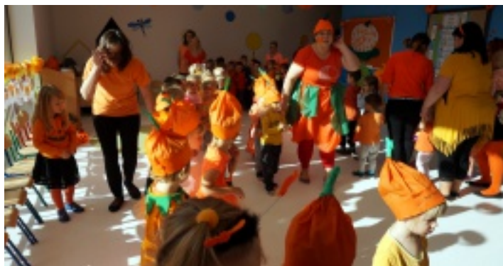
Podczas Święta Dyni królował oczywiście kolor pomarańczowy.

We wszystkich grupach wiekowych dzieci odkrywały i poznawały na różne sposoby walory warzyw z rodziny dyniowatych, a także potrawy jakie można z nich przygotować. Dzieci wraz ze swoimi wychowawczyniami wydrążyły oraz ozdabiały dynie. W grupach nie zabrakło gier i zabaw ruchowych z dynią. Wiele radości przyniosły przedszkolakom kręgle z dyniową kulą oraz slalom między dyniami. W przedszkolnej stołówce królowała zupa dyniowa. Na koniec wszystkie grupy spotkały się u „Wiewiórek” i „Tygrysków” w sali łączonej, gdzie w rytm wesołej muzyki odbył się pierwszy jesienny „Bal u Dyni”. Dzieci i pracownicy przedszkola brali udział w takich zabawach jak „Balonowa stonoga” czy „Idzie krasnoludek”. Radości i uśmiechom nie było końca. Po balu każdy przedszkolak i dziecko ze żłobka wróciło do domu z pamiątkowym dyplomem.