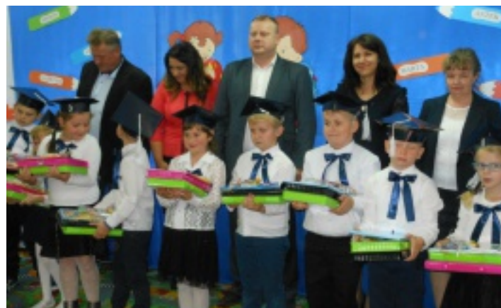
Pierwszoklasiści z Niedźwiedzia i ich goście.