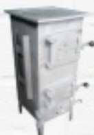
OGRZEWACZ POMIESZCZEŃ 139,99 ZŁ