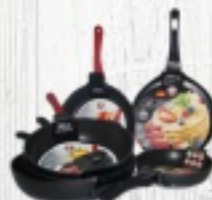
PATELNIĄ ROYAL RÓŻNE ROZMIARY od 42,50 ZŁ