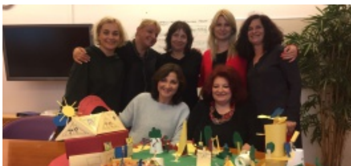
Nauczyciele ze Strawczyna szkolili się m.in. w Finlandii.