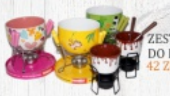
ZESTAW DO FONDUE 42 ZŁ