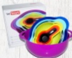
ZESTAW MISEK I MIAREK BE SMART 44 ZŁ