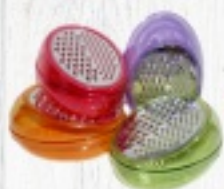
TARKA OVAL 13,50 ZŁ