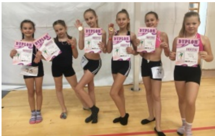
Turniej w Bilczy był pierwszym w tym sezonie dla OLIMPIC Dance Studio.

Blisko trzystu tancerzy z całej Polski stanęło ze sobą w szranki 28 października 2017 r. podczas IV Ogólnopolskiego Turnieju Tańca Freestyle o Puchar Burmistrza Miasta i Gminy Morawica.