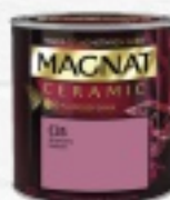
MAGNAT CERAMIC 2,5L 73 ZŁ