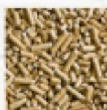
PELLET 6MM WOREK 15KG 13 ZŁ 1 TONA 830 ZŁ