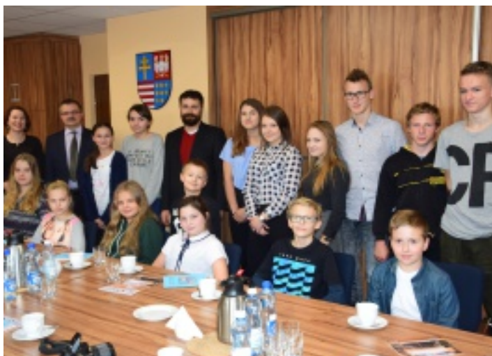
Przedstawiciele Samorządu Uczniowskiego z Oblęgorka wraz z opiekunami podczas wizyty w Urzędzie Marszałkowskim Województwa Świętokrzyskiego w Kielcach.