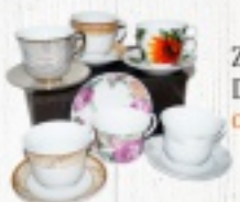
ZESTAW FILIŻANEK DLA 6. OSÓB od 45,60 ZŁ