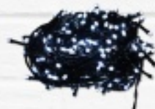
LAMPKI ŚWIĄTECZNE LED