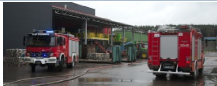
W ćwiczeniach wzięły udział także jednostki z naszej gminy: OSP Promnik i OSP Strawczyn.