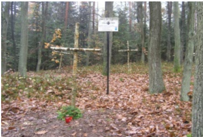
Dzieci ze świetlic SCKiS odwiedziły m.in. cmentarz wojenny w lesie koło Korczyna.

Podobnie jak w ubiegłym roku, w ramach zajęć na świetlicach prowadzonych przez Samorządowe Centrum Kultury i Sportu, zorganizowane zostały wyjścia do zapomnianych grobów.