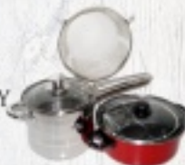
RONDEL DO FRYTEK 75 ZŁ GARNEK DO FRYTEK 29 ZŁ SITKO DO FRYTEK od 4,30 ZŁ