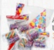
AKCESORIA URODZINOWE 3,40 ZŁ