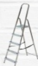
DRABINY ALUMINIOWE od 90 ZŁ