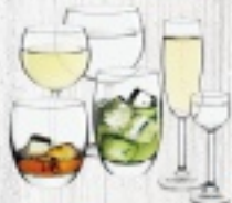
ZESTAW KROSNO PRESTIGE BRYLANT 36 ELEMENTÓW 235 ZŁ