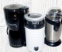
MEYNEK DO KAWY SATURN 82 ZŁ BOTTI 65 ZŁ ELESKO 82 ZŁ