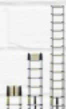
DRABINA TELESKOPOWA 7-STOPNIOWA 199 ZŁ