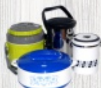
TERMOS OBIADOWE od 17 ZŁ