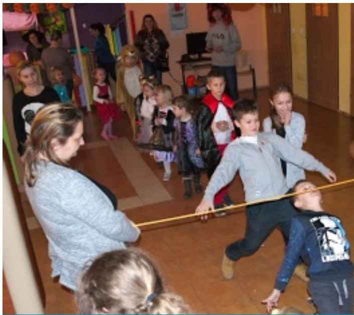
Jedną z zabaw było przechodzenie pod liną.

Ani silny wiatr, ani deszcz nie przeszkodziły dzieciom w dotarciu na bal przebierańców z okazji święta Dyni, który zorganizowało Samorządowe Centrum Kultury i Sportu w Strawczynie w ostatnią sobotę października (28.10.2017 r.) w świetlicy w Oblęgorze.