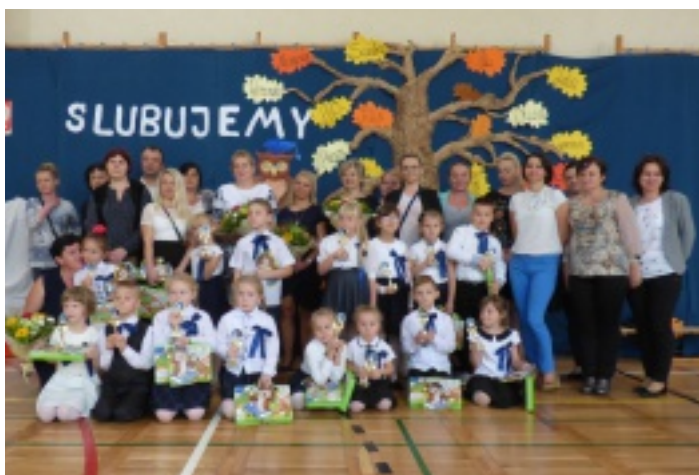
Pierwszaki z gośćmi przybyłymi na ślubowanie.