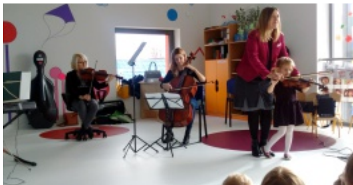
Dzieci mogły spróbować swoich sił w grze na instrumentach.