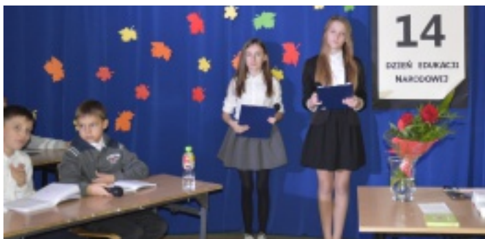
Dzień Nauczyciela w Szkole Podstawowej w Chełmcach.