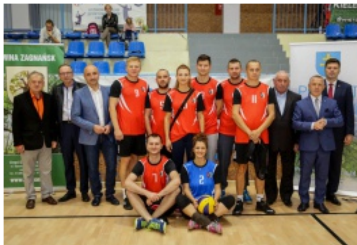
Drużyna ze Strawczyna zajęła w Zagnańsku II miejsce.