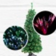
CHOINKI ZE ŚWIATŁOWODEM NISKIE CENY