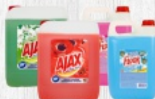
AJAX 5L 39 ZŁ FLOOR 5L 24 ZŁ