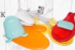
AKCESORIA SILIKONOWE RĘKAWICA 11 ZŁ RĘKAWICA PYSZCZEK 8,30 ZŁ PODSTAWKA 10 ZŁ ŁOPATKA 5,20 ZŁ PĘDZELEK 4,80 ZŁ