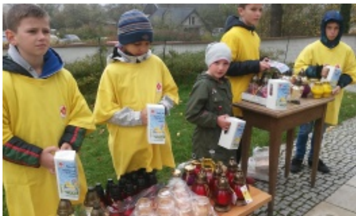
Wolontariusze zbierali pieniądze na hospicjum w Kielcach.

W niedzielę 22 i 29 października 2017 r. Szkolne Koło Caritas przy Szkole Podstawowej w Chełmcach uczestniczyło w akcji „Znicz” promowanej przez Caritas Diecezji Kieleckiej.