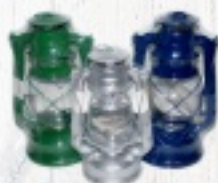
LAMPA NAFTOWA DUŻA 21 ZŁ MAŁA 18 ZŁ