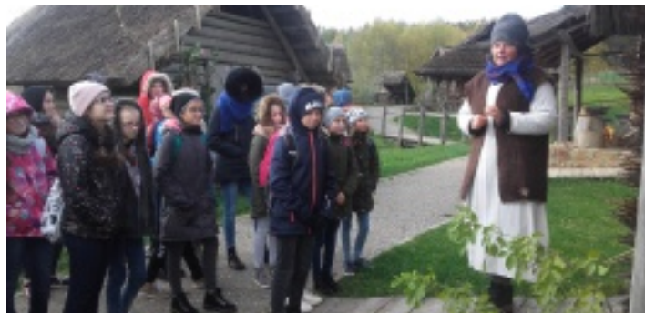
W Osadzie Średniowiecznej w Hucie Szklanej.