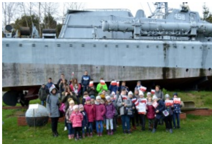
Uczestnicy wyjazdu na tle kutra torpedowego ORP „Odważny”.

Na wystawie plenerowej obejmującej 1,5 ha podziwialiśmy jedną z największych kolekcji militariów w Polsce. Wyjątkowe eksponaty są podzielone na części: lotniczą, morską, artylerii lufowej oraz artylerii raketowej. Jednak największą atrakcją było wejście do samolotu transportowego IŁ-14, gdzie cała grupa bardzo chętnie skorzystała z okazji „pilotowania” tej olbrzymiej maszyny.