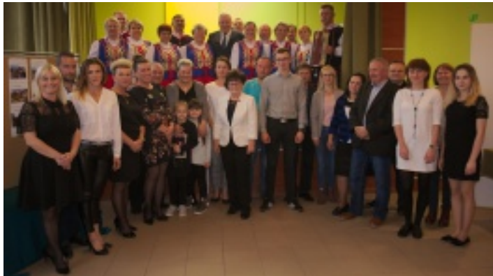
Finał konkursu odbył się w sali SCKiS w Strawczynie.

18 października 2017r. w świetlicy Samorządowego Centrum Kultury i Sportu w Strawczynie odbyło się podsumowanie konkursu „Najbardziej zadbana zagroda wiejska i działka” w Gminie Strawczyn.