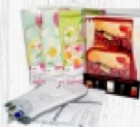
AKCESORIA KUCHENNE od 6,50 ZŁ