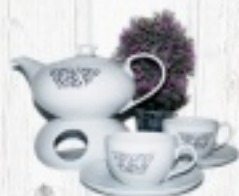
ZESTAW ĆMIELÓW YVONNE DLA 2. OSÓB 120 ZŁ