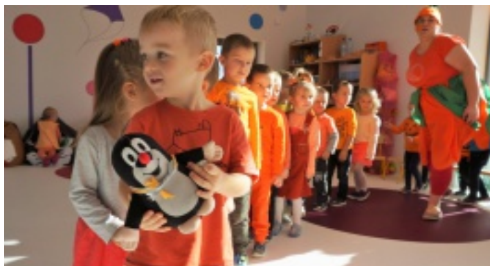
Krecik bawił się wspólnie z przedszkolakami.