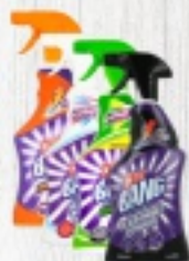
CILLIT BANG RÓŻNE RODZAJE 15 ZŁ