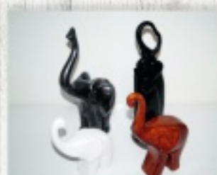
słoniki na szczęście