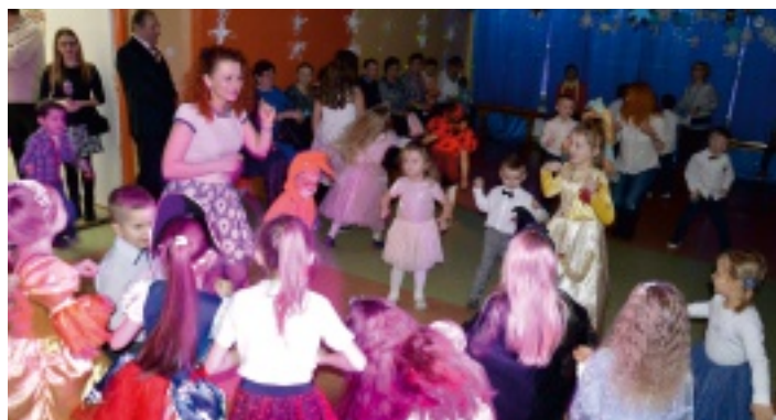
Bal karnawałowy w Chełmcach.

W dniach 21 stycznia (dla najmłodszych uczniów) i 24 stycznia (dla dzieci z klas IV-VI) odbywały się w Szkole Podstawowej w Chełmcach zabawy karnawałowe. W tych dniach dzieciom towarzyszyło wiele emocji i wrażeń. Sala gimnastyczna wyglądała inaczej niż na co dzień – zamieniła się w prawdziwą salę balową. Udekorowana kolorowo zachęcała do zabawy. W szkole zaroilo się od Spiderman'ów, policjantów, strażaków, rycerzy, kowbojów rodem z Dzikiego Zachodu, klaunów, czarodziejów... Były wróżki, księżniczki, motyle, biedronki oraz różne inne stwory. Stroje były barwne, oddawały nawet najdrobniejsze szczegóły wybranej postaci. Niektórzy byli nie do poznania, inni budzili podziw, a niekiedy nawet