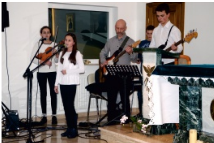
Koncert obłęgorskich uczniów w hospicjum w Kielcach.

11 i 15 stycznia 2017 r. uczniowie i absolwenci Zespołu Placówek Oświatowych w Oblęgorku śpiewem kołęd i pastoralek, recytacją wierszy i tekstów bożonarodzeniowych wypełnili Hospicjum im. św. Matki Teresy z Kalkuty w Kielcach oraz kościół parafialny w Chełmcach.