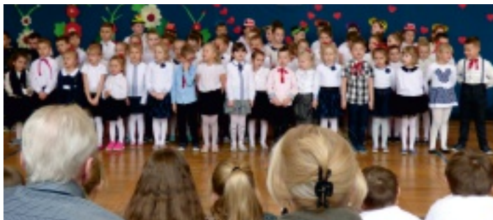
Uczniowie z Promnika nie zapomnieli o seniorach...

Jest taki dzień, jeden w roku, bardzo ciepły, choć styczniowy... Tak parafrazując słowa pewnej piosenki, możemy nawiązać do dnia rzeczywiście szczególnego, bardzo ciepłego i zawsze radosnego – Dnia Babci i Dziadka. No bo któż, myśląc o swoich dziadkach, nie uśmiechnie się, nie rozraduje i nie powie – zawsze – ciepłego słowa.