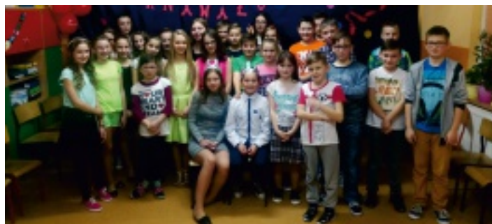
Król i Królowa Balu klas IV-VI wraz ze swoim "dworem".