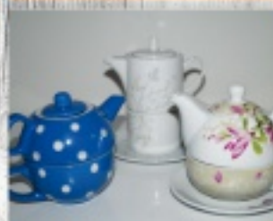
filiżanka z dzbankami