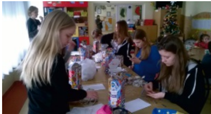
Wolontariuszki liczą zebrane pieniądze.