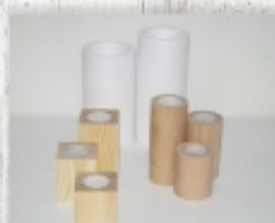
świeczniki drewniane i ceramiczne