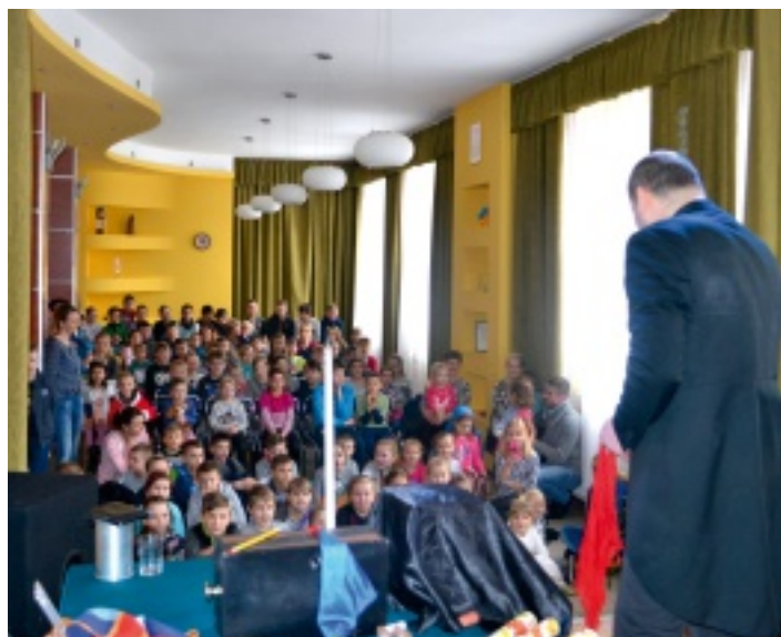
Po pokazie iluzjonistycznym każdy chętny mógł poznać tajniki magicznych sztuczek...

Nie zabrakło również wyjazdu do kina na film pt. „Sing”. Jak to w kinie najczęściej bywa wszystkie dzieciaki miały dobre humory. Natomiast po seansie czekała na nie pyszna niespodzianka – pizza. Wszystkie wyjazdy odbyły się dzięki finansowemu wsparciu Urzędu Gminy w Strawczyniu, za które serdecznie dziękujemy.