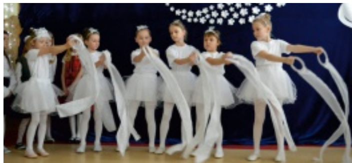
Dzieci ze Strawczyna przygotowały bogaty program artystyczny.

„Niech nam żyją wszystkie Babcie i Dziadkowie też...” to hasło, które przyświecało uroczystej akademii przygotowa-