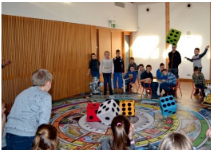
W Centrum Geoedukacji nauka łączona jest z zabawą.

Dużym zainteresowaniem dzieci cieszyła się przygotowana oferta wyjazdowa. W pierwszym tygodniu ferii została zorganizowana wycieczka do Muzeum Lat Szkolnych Stefana Żeromskiego w Kielcach. Była to dla dzieci niezwykła lekcja historii. Podczas zwiedzania, dzieci mogły zobaczyć jak wyglądała szkolna sala, usiąść w drewnianych szkolnych ławkach, poznać nazwy i przeznaczenie szkolnych przedmiotów, o których istnieniu dzisiejsi uczniowie nie mają pojęcia. To wszystko przybliżyło dzieciom atmosferę XIX-wiecznej szkoły, w której tylko uprzywilejowani uczniowie mogli pobierać nauki. Drugim punktem wycieczki w tym samym dniu było Centrum Geoedukacji w rezerwacie Wietrznia. Jest to ciekawe miejsce nie tylko dla najmłodszych, a zwiedzanie uatrakcyjniamy multimedialne ekspozycje prehistorycznych zwierząt i wirtualna jaskinia. Jedną z najciekawszych rozrywek Centrum jest kapsuła 5D, która zabiera uczestników w podróż do „wnętrza Ziemi”.