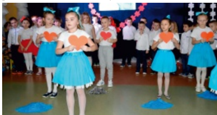
Program artystyczny przygotowali uczniowie klas 0-III.

Od wielu lat w kalendarz uroczystości szkolnych wpisany jest Dzień Babci i Dziadka. To dzień pełen uśmiechu, radości i wzruszeń. Dnia 21 stycznia 2017 r. w Szkole Podstawowej w Chełmcach odbyła się wspaniała uroczystość pod hasłem: „Kocham Babcię i Dziadka”.