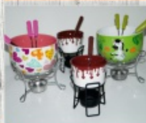
zestawy do czekoladowego fondue