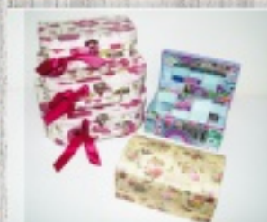
kasetki i skrzyneczki