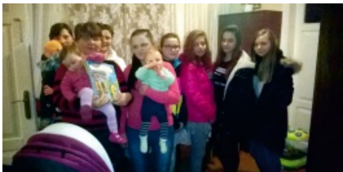
Szkolne Koło Caritas z wizytą w Wiernej Rzece.

18 stycznia chórki szkolny odwiedził Dom Opieki Społecznej w Rudzie Strawczyńskiej. Uczennice zaprezentowały najpiękniejsze polskie kolędy i pastorałki, rozświetlając nieco,