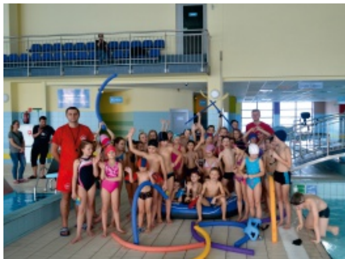
Jak co roku moc atrakcji przygotowała pływalnia OLIMPIC.

Nie możemy zapomnieć również o ciekawym wydarzeniu jakim było zorganizowanie dla naszych milusińskich balu karnawałowego w świetlicy w Chełmcach. Dzieci przygotowały się do tej imprezy już odpowiednio wcześniej, wykonując w świetlicach maski karnawałowe, które podczas balu tajemniczo skrywały twarze. Zabawa karnawałowa była świetną, wesołą rozrywką przy dźwiękach muzyki tanecznej, a wystrój sali dodatkowo pogłębiał karnawałowy klimat. Były szalone konkursy z upominkami oraz słodki poczęstunek – karnawałowe różę wypiekane pod czujnym okiem pań z Koła Gospodyń Wiejskich w Chełmcach. Po balu dzieciaki pełne dobrych humorów udały się do domów zabierając ze sobą wesołe buźki, pięknie wymalowane w bajeczne postacie.