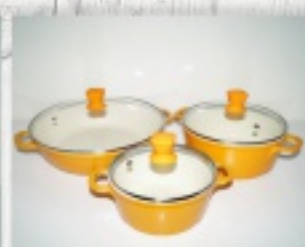
garnki i patelnie ceramiczne