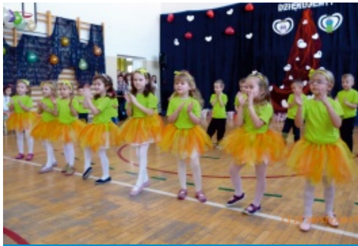
W Szkole Podstawowej w Korczynie Dzień Babci i Dziadka został połączony z balem karnawałowym.

W Szkole Podstawowej im. Jana Pawła II w Korczynie 28 stycznia 2017 r. o godzinie 12:00 odbyła się uroczystość z okazji Dnia Babci i Dziadka połączona z balem karnawałowym. Akademia poświęcona została Babciom i Dziadkom z okazji ich minionego święta. Zaproszeni goście licznie przybyli, aby podziwiać występy swoich wnucząt.