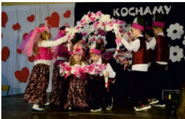
Uczniowie klasy IIa wykonują taniec rosyjski.

Zbliżający się do szkoły w Oblęgorku 20 stycznia 2017 r. babcie i dziadkowie to nieomylny znak, że uczniowie klas 0-III zaprosili swoich najbliższych na uroczystość z okazji Dnia Babci i Dnia Dziadka. Podniosła atmosfera, pięknie przystrojona sala gimnastyczna, dzieci w barwnych strojach, przygotowany słodki poczęstunek, prezenty, to wszystko dla kochanych babć i dziadków.