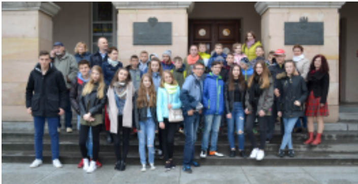
Uczestnicy wyjazdu przed WDK w Kielcach.

W dniach od 24 do 28 kwietnia 2017 r. w stolicy województwa świętokrzyskiego zaplanowano wiele wydarzeń, mających upamiętnić Zbrodnię Katyńską z 1940 roku. Przez 5 dni w kilku kieleckich instytucjach odbywały się spotkania z historykami i kombatanami, można było uczestniczyć w wystawach oraz wykładach, a także oglądać filmy i przedstawienia związane z wydarzeniami sprzed 77 lat.