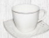
ZESTAW FILIŻANEK NA 6 OS. 105 zł