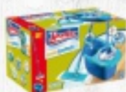
MOP SPONTEX 141 zł