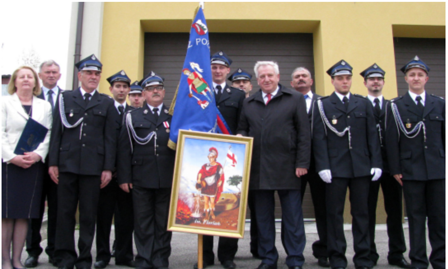
OSP w Strawczynku z nowym obrazem swojego patrona - św. Floriana.