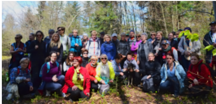
W "Spacerze z Przewodnikiem" wzięło udział ponad 70 osób.