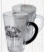
SZKLANKA SWEET HOME 7,10 zł