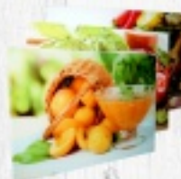
DESKA SZKLANA 30X20 9,50 zł 35X25 13,50 zł