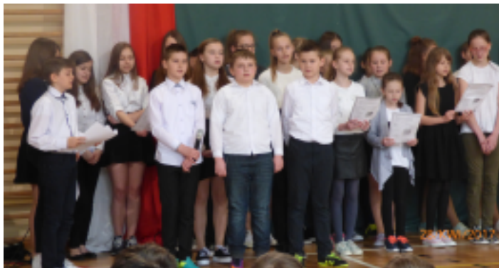
Uroczysta akademii z okazji Święta Trzeciego Maja.

Z racji długiego, majowego weekendu już w piątek 28 kwietnia przypomnieliśmy wszystkim okoliczności i wagę uchwalenia w naszym kraju Konstytucji 3 maja. Krótka lekcja historii bardzo podobała się naszym uczniom.