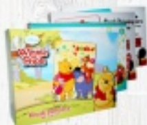
KOCYK DISNEY 80X110 65 zł 100X140 90 zł