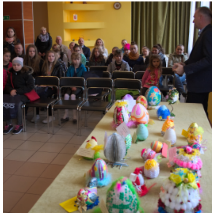
Do konkursu zgłoszono blisko 30 pisanek.