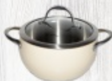
GARNEK NIERDZ. NEBULA od 75 zł