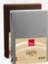
PRZEŚCIERADŁO FROTTE 160X200 41 zł 220X200 54 zł