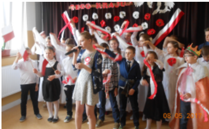
Uczniowie z SP w Rudzie Strawczyńskiej z okazji Święta Trzeciego Maja śpiewali patriotyczne pieśni.

Patriotyczne apele rocznicowe w Szkole Podstawowej w Rudzie Strawczyńskiej są tradycją. W corocznym kalendarzu uroczystości szkolnych nie mogło zabraknąć więc akademii poświęconej kolejnej rocznicy uchwalenia Konstytucji 3 Maja.