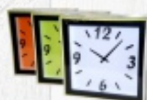
ZEGAR RÓŻNE WZORY od 13,50 zł