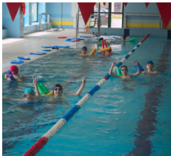
Program Ministerstwa Sportu i Turystyki „Umiem Pływać” potrwa do końca roku szkolnego, czyli do 24 czerwca 2017 r.