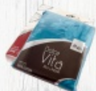
POŚCIEL RÓŻNE ROZMIARY od 40 zł