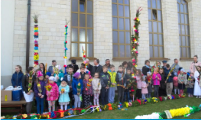
Najwyższą palmę - 13-metrową - wykonało Stowarzyszenie Przyszłość Strawczynka.

Małe palemki ze zbóż i kilkumetrowe, misternie zdobione konstrukcje z kwiatami z krepiny i dziesiątkami różnokolorowych wstążek – Niedziela Palmowa to piękna uroczystość rozpoczynająca Wielki Tydzień.