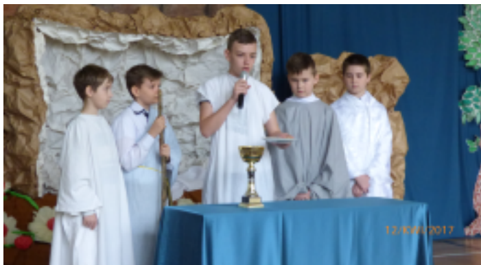
Uczniowie z Promnika zainscenizowali "Misterium paschalne".

W tym roku kwiecień to przede wszystkim miesiąc Wielkiej Nocy. Dlatego oczywiście przygotowaliśmy „Misterium paschalne”, czyli inscenizację ostatnich, bardzo ważnych dni w życiu Chrystusa, jego męki i zmartwychwstania. Przedstawienie, wzbogacone wieloma znanymi pieśniami, na długo przykuło uwagę wszystkich zgromadzonych na sali gimnastycznej, na której panowały cisza i skupienie. Nie zabrakło także łez wzruszenia.