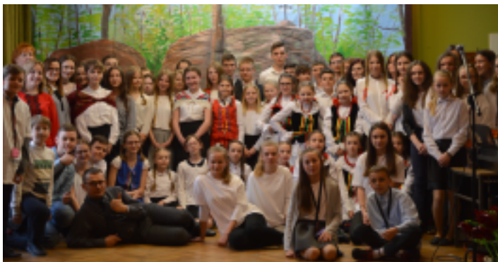
Uczestnicy i organizatorzy konkursu.