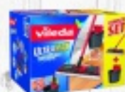
MOP VILEDA 110 zł