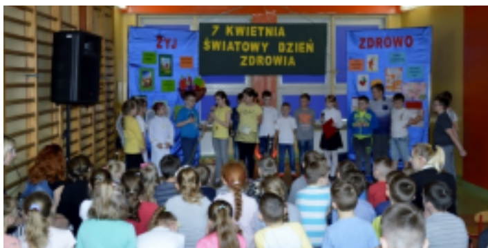
Uczniowie z Chełmiec wiedzą co to znaczy "zdrowy styl życia".