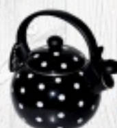
CZAJNIK RETRO 60 zł