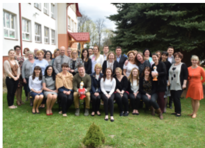
Wspólne zdjęcie nauczycieli projektu T.A.L.E. Erasmus.

gami proste zwroty w języku angielskim. Wizyta zakończyła się wspólnym obiadem z gronem pedagogicznym oraz pamiątkowym zdjęciem. Anglicy zapewniali, że do swojej szkoły wracają z bagażem nowych doświadczeń, a poznane techniki pracy z uczniami będą chcieli zastosować w pracy ze swoimi uczniami.