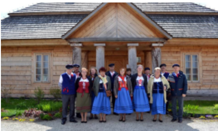
Zespół ludowy "Swojaki" ze Strawczyna.

1 maja 2017 r. Zespół ludowy Swojaki ze Strawczyna wziął udział w eliminacjach rejonowych do XLI Buskich Spotkań z Folklorem.