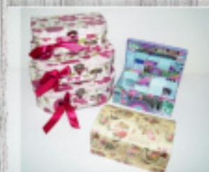
kasetki i skrzyneczki