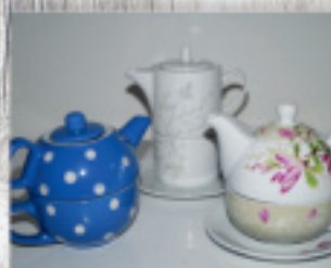
filiżanka z dzbankami