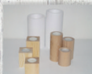
świeczniki drewniane i ceramiczne