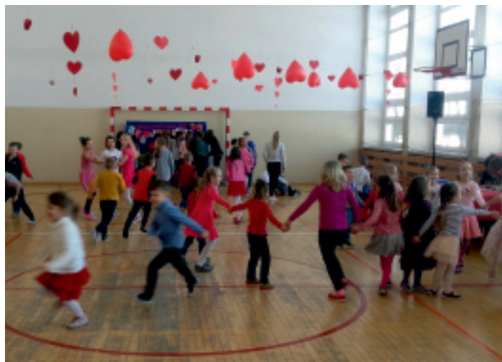
Serduszka to obowiązkowa dekoracja w święto zakochanych.

Wyjątkowo starannie zaplanowano liczne zabawy i konkursy z nagrodami, które cieszyły się dużą popularnością wśród naszych dzieci. Tradycyjnie odbył się konkurs plastyczny na najładniejszą kartkę walentynkową, konkurs piosenki walentynkowej oraz konkurs na najsympatyczniejszą dziewczynkę i chłopca naszej szkoły. Następnego dnia odbyła się walentynkowa dyskoteka. Uczniowie bawili się pod czujnym okiem