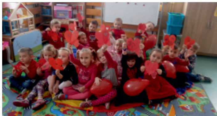
Wszystkie przedszkolaki 14 lutego ubrały się na czerwono.

14 lutego 2017 r. dzieci ubrały się na czerwono i tym samym zapoczątkowały dzień miłych wrażeń. Przedszkolaki wzięły udział w różnych zabawach związanych z walentynkami m.in.: szukały drugiej połówki serca, rozwiązywały zagadki dotyczące bohaterów bajek, bawiły się zrobionymi przez siebie papierowymi serduszkami i zaśpiewały piosenkę „Dumka na dwa serca”. Jak każdego roku była też lubiana przez wszyst-