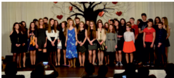
Koncert Walentynkowy w ZPO w Oblęgorku.

16 lutego 2017 r. w Zespole Placówek Oświatowych w Oblęgorku o godzinie 18.00 sala gimnastyczna wypełniła się gośćmi, którzy jak co roku przybyli, by wspólnie z uczniami naszej szkoły świętować Dzień Zakochanych.