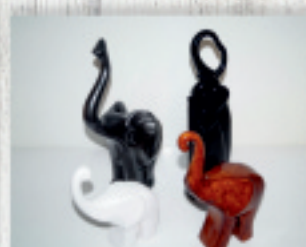
śłoniki na szczęście