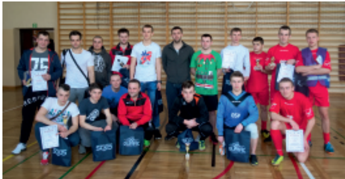
W zawodach wzięły udział 4 drużyny.

4 marca 2017 r. w hali sportowej przy Zespole Placówek Oświatowych w Promniku został rozegrany Halowy Turniej Piłki Nożnej o Puchar Wójta Gminy Strawczyn, którego organizatorem było Samorządowe Centrum Kultury i Sportu w Strawczynie. Drużyny grały systemem każdy z każdym, a wszystkie spotkania sędziował Jacek Wójcik, który na co dzień sędziuje mecze IV ligi.