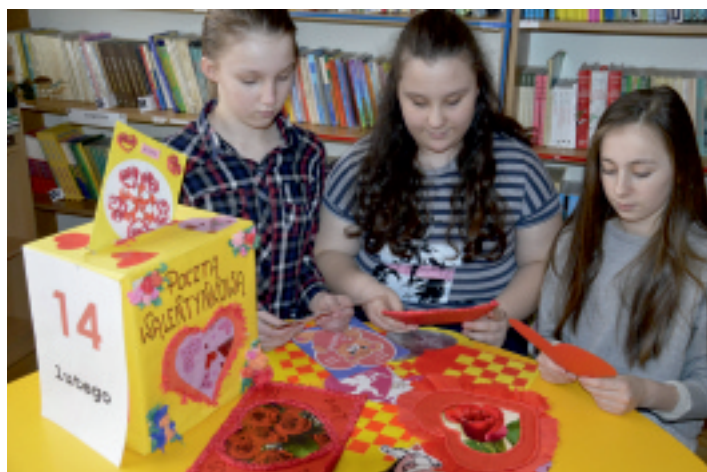
Walentynkowa poczta w Chełmcach miała pełne ręce roboty.

Szkoła to nie tylko nauka i praca. To także wychowanie, z którym wiąże się zabawa. W Szkole Podstawowej w Chełmcach 14 lutego, jak co roku, obchodzono Dzień Zakochanych, czyli popularne walentynki.