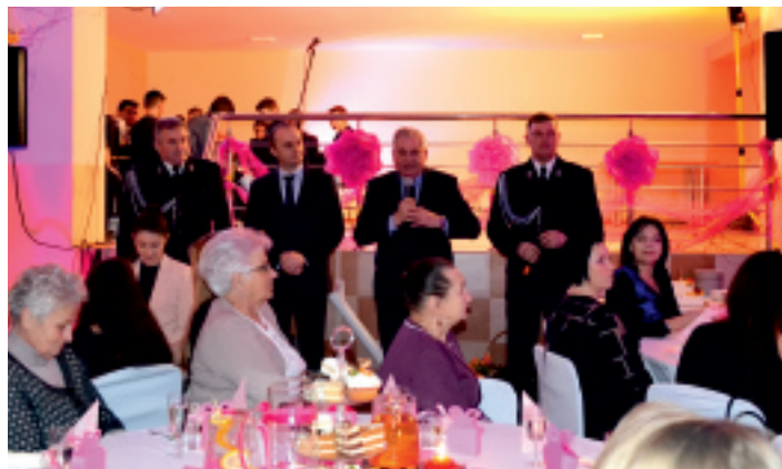
Gospodarze wieczoru złożyli Paniom życzenia i wręczyli kwiaty.

8 marca 2017 r. w remizie w Promniku odbyły się uroczyste obchody Dnia Kobiet w Gminie Strawczyn. Spotkanie dla Pań zorganizowane zostało przez Samorządowe Centrum Kultury i Sportu w Strawczynie oraz Ochotniczą Straż Pożarną w Promniku, przy udziale Urzędu Gminy w Strawczynie.