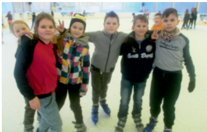
Uczniowie z Niedźwiedzia kolejny raz wybrali się na lodowisko.