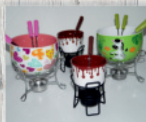
zestawy do czekoladowego fondue