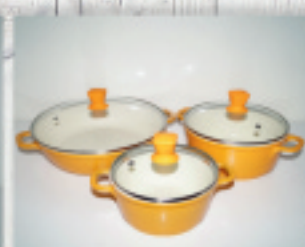
garnki i patelnie ceramiczne