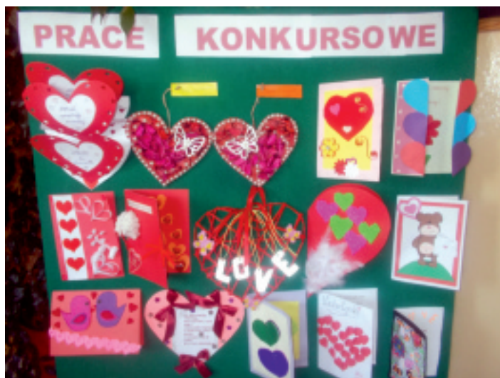
Konkursowe kartki wykonane przez uczniów z Niedźwiedzia.