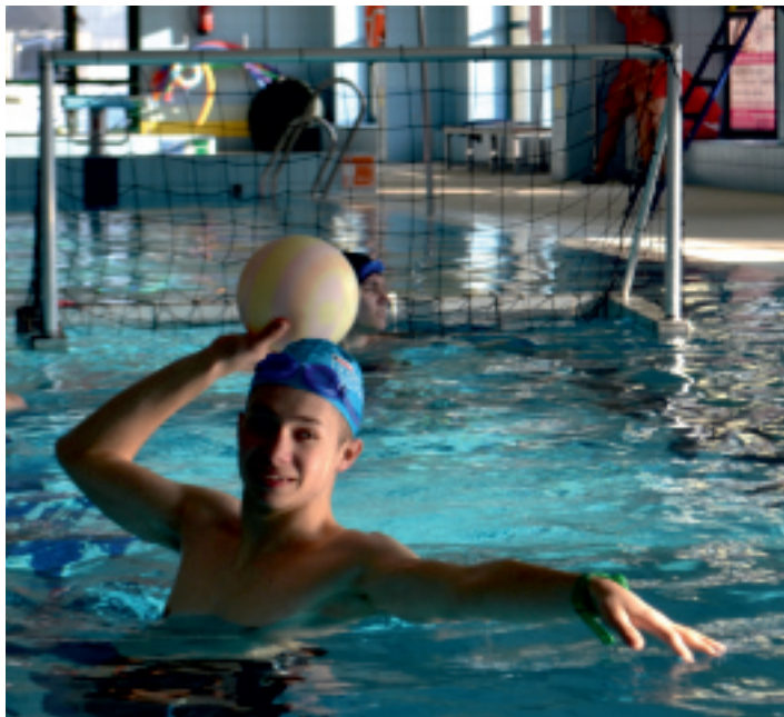
Sprzęt do gry w piłkę wodną (waterpolo) na pływalni OLIMPIC udostępniany jest bezpłatnie.

Od lutego 2017 r. na krytej pływalni OLIMPIC w Strawczyńku można bezpłatnie zagrać w piłkę wodną. Podczas ferii zimowych zajęcia waterpolo cieszyły się bardzo dużą popularnością i wychodząc naprzeciw oczekiwaniom klientów zostały wprowadzone do stałej oferty basenu.