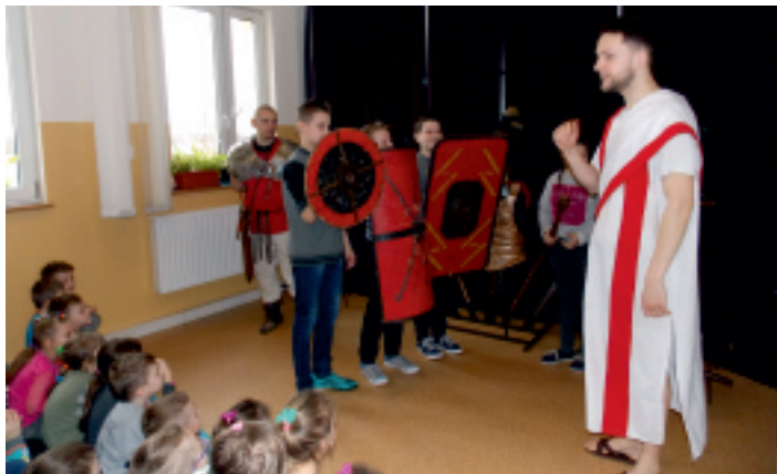
Do szkoły w Rudzie Strawczyńskiej zawitali Rzymianie.

24 lutego 2017 r. w Szkole Podstawowej w Rudzie Strawczyńskiej odbyła się żywa lekcja historii przeprowadzona przez Grupę Artystyczną Rekonstrukto na temat „Rzymskie imperium i tradycje antyku”.