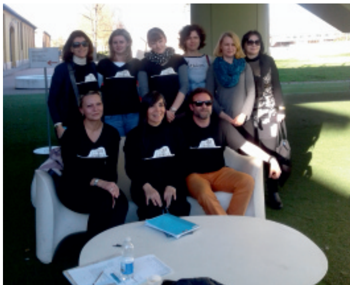
Przed Centrum Edukacyjnym w Reggio Emilia.

27 lutego w szkole podstawowej we włoskim miasteczku Travo uczestnicy projektu z Hiszpanii, Estonii, Słowacji oraz Polski zostali bardzo serdecznie przywitani przez uczniów, nauczycieli oraz samego burmistrza. Następnie odbyło się spotkanie integracyjne, podczas którego goście mogli dokładnie zapoznać się ze szkołą, uczestnicząc w zabawnej grze edukacyjnej wymagającej wędrowania po całym budynku. Głównym punktem zajęć zorganizowanych podczas tego dnia było zaprezentowanie przez reprezentantów wszystkich partnerskich szkół efektów pracy uczniów w formie multimedialnej i papierowej. Nauczyciele mieli także okazję „na żywo” obejrzeć prezentacje włoskich uczniów. Następnie dokładnie omówiono i podsumowano to przeprowadzone we wszystkich krajach partnerskich działanie projektowe związane z poznawaniem różnych gatunków drzew, wyszukiwaniem na ich temat informacji, tekstów