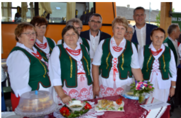
Koło Gospodyń Wiejskich z Chełmiec przygotowało Jaglanki w sosie kurkowym .