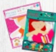
FILCOWE ROBÓTKI od 29,90 ZŁ