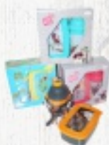
ZESTAW ŚNIADANIOWY 29,90 ZŁ