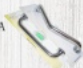
UCHWYT DO WANNY od 85 ZŁ