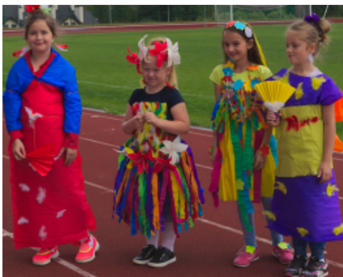
Każda grupa przygotowała orientalny strój.