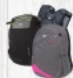
PLECAK 4F od 69 ZŁ