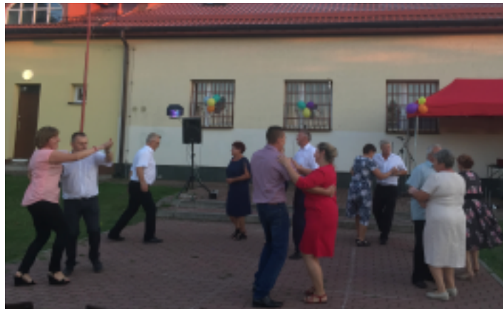
Festyn odbył się na placu za remizą OSP w Strawczyнку.

Oprócz wymienionych atrakcji wszyscy uczestnicy festynu mogli skosztować smacznego tradycyjnych potraw oraz ciast przygotowanych przez członków Stowarzyszenia „Przyszłość Strawczynka”. Na zakończenie odbyła się zabawa na świeżym powietrzu.