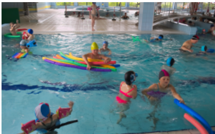
Jak co roku dzieci korzystały z atrakcji Centrum Sportowo-Rekreacyjnego OLIMPIC w Strawczynku, m.in. z basenu.