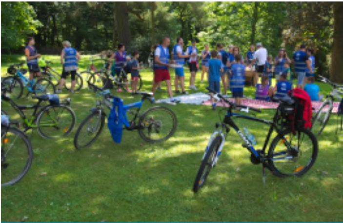
Słodki poczęstunek w parku obok Pałacyku w Oblęgorku.

W upalne niedzielne przedpołudnie 9 lipca 2017 r. na parkingu Centrum Sportowo-Rekreacyjnego OLIMPIC w Strawczynku spotkała się grupa chętnych do wspólnej przejażdżki wokół gminy Strawczyn. Rodzinny Rajd Rowerowy organizowany przez Samorządowe Centrum Kultury i Sportu w Strawczynie zgromadził ok. 50 osób w bardzo szerokim przedziale wiekowym - wszystkich połączyła chęć aktywnego spędzenia czasu.