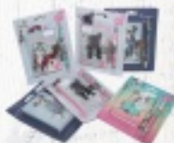
NOTES Z DŁUGOPISEM od 12 ZŁ