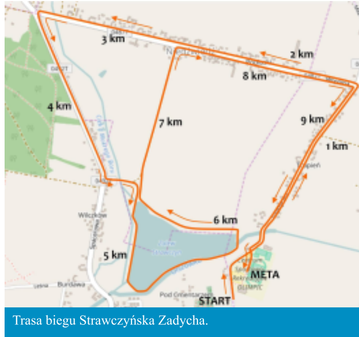
Trasa biegu Strawczyńska Zadycha.

Samorządowe Centrum Kultury i Sportu w Strawczynie, w związku z organizacją STRAWCZYNADY 2017, zawiadamia o wprowadzeniu czasowej organizacji ruchu (19 i 20 sierpnia 2017 r.) na drodze gminnej ul. Turystyczna w Strawczynku, drodze powiatowej 0487T w miejscowościach Strawczynek, Niedźwiedź i Strawczyn oraz drodze wojewódzkiej nr 748 w Strawczynie.