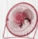
WENTYLATOR USB 26 ZŁ