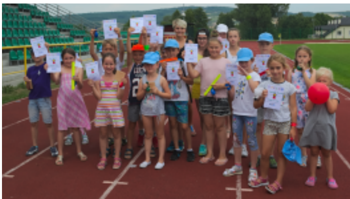
W półkoloniach wzięło udział ponad 50 dzieci.

Świetna zabawa, ciekawe wycieczki, twórcze malowanie i cały wachlarz zajęć – to tylko część atrakcji, które przyciągnęły blisko 60 dzieci do udziału w półkoloniach zorganizowanych przez Samorządowe Centrum Kultury i Sportu w Strawczyniu od 24 lipca do 4 sierpnia 2017 r. Codziennie przez 6 godzin uczestnicy mieli zapewnioną opiekę, a program był bogato wypełniony – nie sposób było się nudzić.