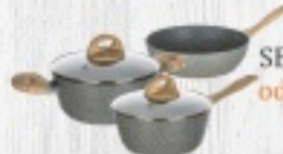
SERIA NATURAL od 65 ZŁ

Promocja! do 16.09 wszystkie patelnie 10% taniej!