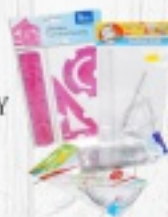
PRZYBORY GEOMETRYCZNE od 2,50 ZŁ