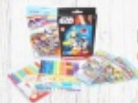
FLAMASTRY od 2,50 ZŁ