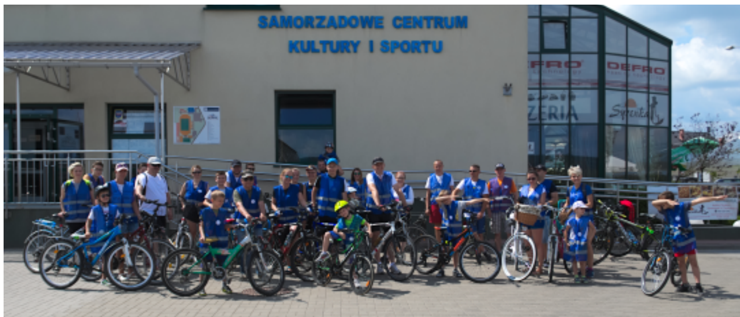
Rajd rozpoczął się na terenie Centrum Sportowo-Rekreacyjnego OLIMPIC w Strawczynku.