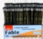
OŁÓWEK, RÓŻNE TWARDOŚCI 1,90 ZŁ