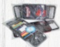
PIÓRNIK Z WYPOSAŻENIEM 38,90 ZŁ