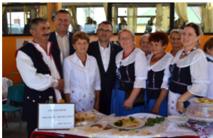
Stowarzyszenie Przyszłość Strawczynka przygotowało Pierogi z kaszą gryczaną i pieczarkami .

Sos kurkowy: Kurki drobno pokroić i podsmażyć na maśle. Gdy zmiękną dodać śmietanę i gałązkę koperku. Gotować do momentu aż śmietana zacznie gęstnieć. Doprawić solą i pieprzem.