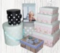
PUDEŁKA OZDOBNE od 5 ZŁ