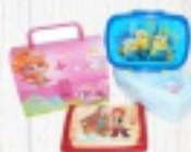
PUDEŁKO ŚNIADANIOWE od 5 ZŁ