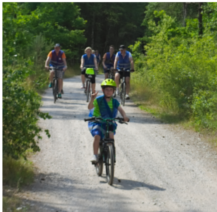
Trasa nie sprawiła problemów nawet najmłodszym uczestnikom.

Pokrzepieni słodkościami rowerzyści ruszyli przez Aleję Lipową, Oblęgór i Niedźwiedz na pierwszy leśny odcinek Rajdu. Trudy jazdy po nieutwardzonych drogach rekompensował cień oraz orzeźwiający zapach lasu. Po krótkim odcinku