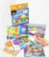
PLASTELINA od 2 ZŁ