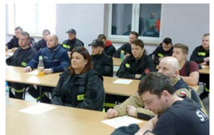
Strażacy z gminy Strawczyn zdali egzamin z kwalifikowanej pierwszej pomocy i zyskali uprawnienia ratowników