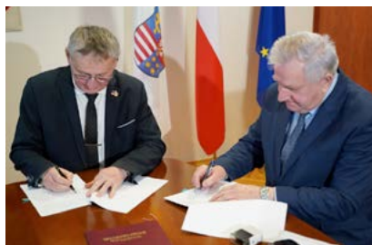
W Oblęgorku powstanie Centrum Opiekuńczo-Mieszkalne. Umowa z wykonawcą już podpisana!