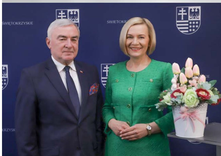
Andrzej Bętkowski Marszałek Województwa Świętokrzyskiego